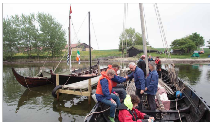
Med vinden i ryggen var det ikke vanskeligt at få skibet i havn.