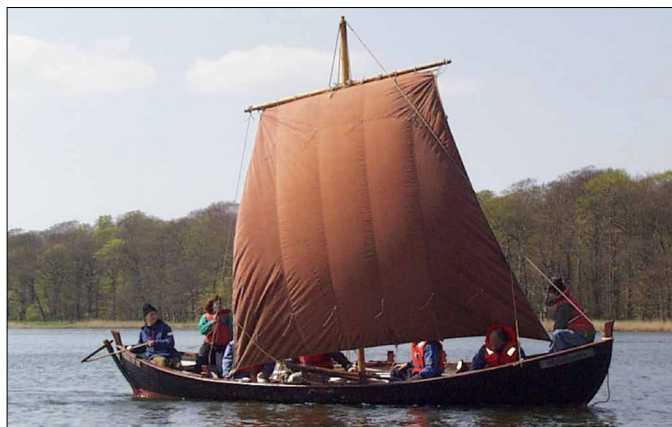
Ottar Als fra Augustenborg