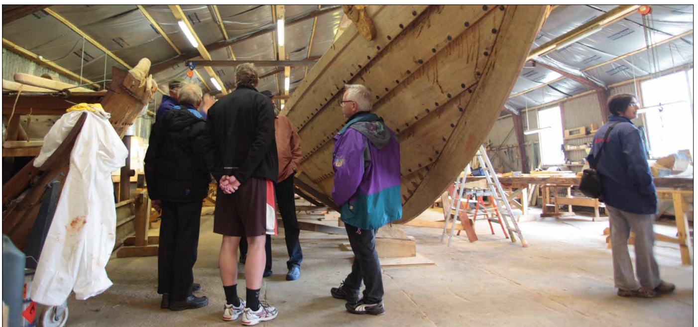
Fra besøget på nydam værftet hvor det imponerende skib bygges.