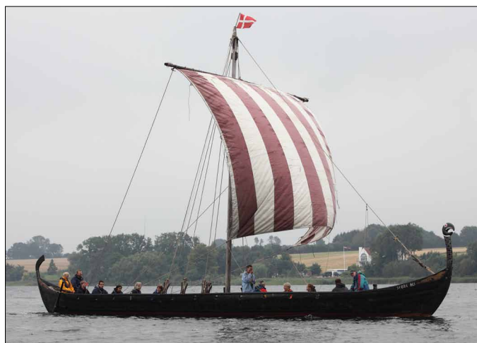
Sebbe Als fra Augustenborg