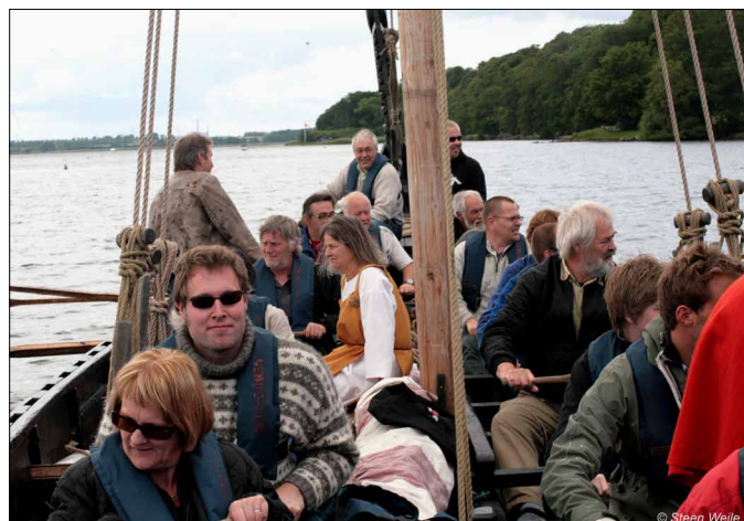
Skibet roes ud til nausten af medlemmer og gæster

Ud over håndskænket fadøl var der hjemmebagt brød med pålæg og så en lille mjød til (den var biavler-produceret og rigtig god).