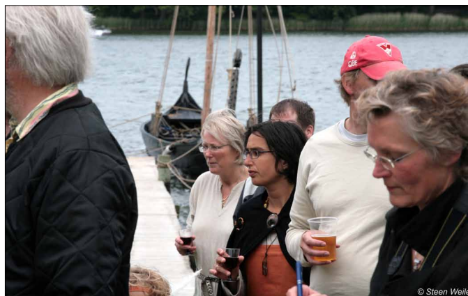
Der blevet skålet i både mjød og øl