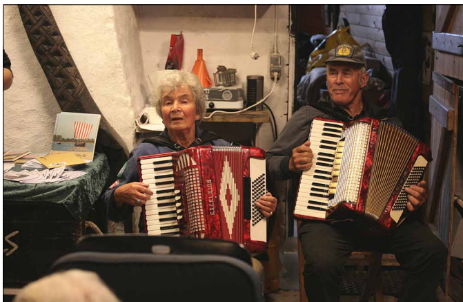
Der var fest og musik i nausten