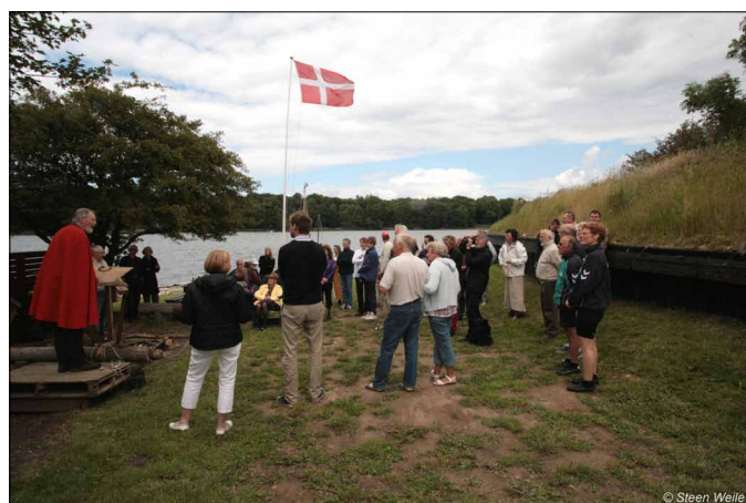
Formanden holdt jubilæumstalen