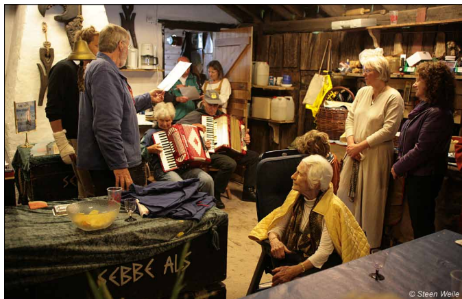
Flere holdt taler for skibet