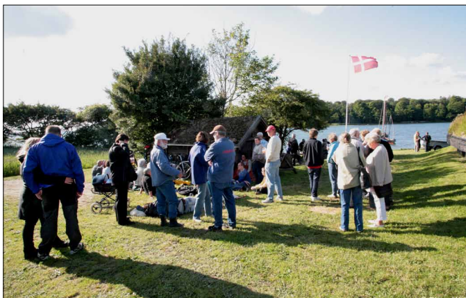
Flot vejr og hygge