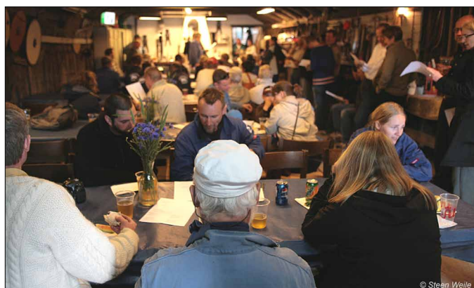
Så var folket bænket og klar til fest