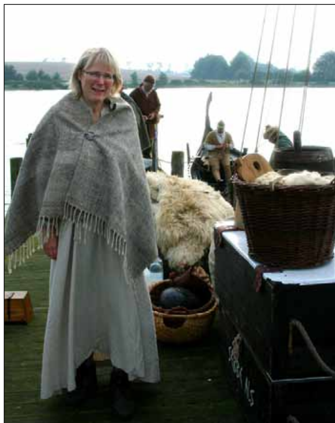
Havnemiljø a la vikingetid