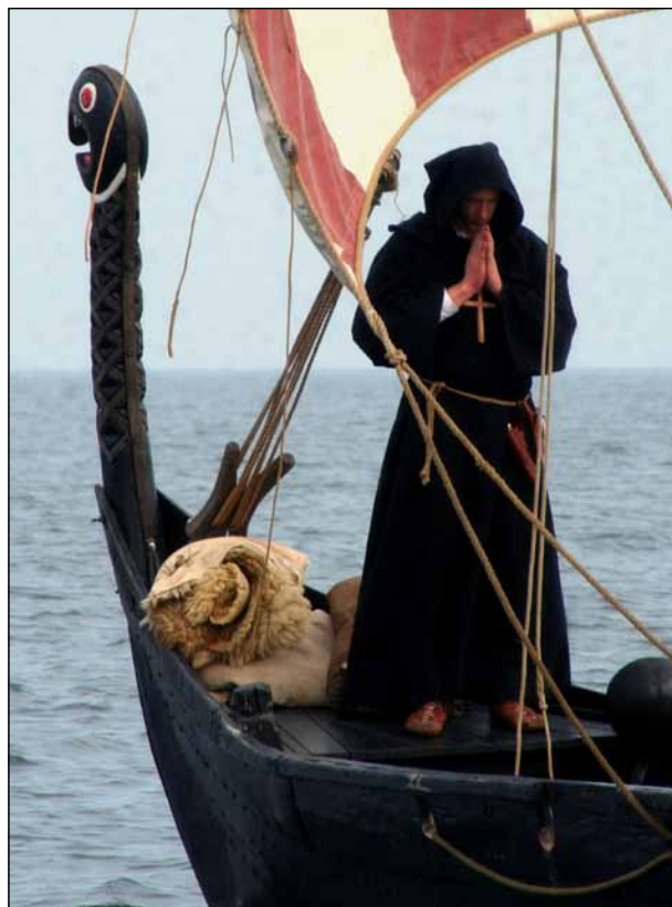
Vikingetidens guder og kristendom mødes