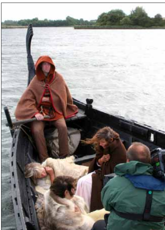
Så er der klar til optagelse - alt tegner fint, men .....