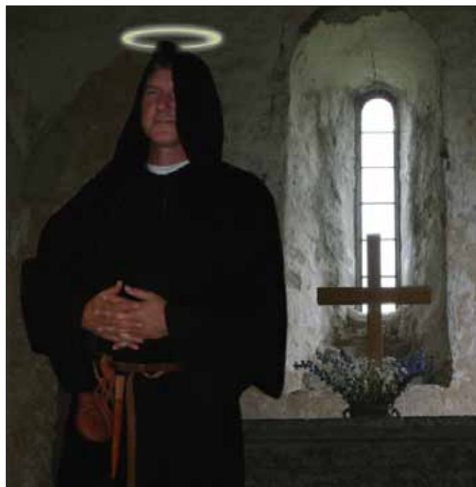
Munken som han ser sig selv

Fredag eftermiddag mødtes vi fire personer på havnen. Fie blev tanket op og gjort klar - der blev hentet redningsveste m.m. og så blev Sebbe ellers hængt bagefter. Ved nausten droppede vi ankeret og Fie sejlede ind efter fire af de gamle sorte kasser. Sebbe blev atter hængt bagefter og så gik det videre mod Dyvig. Vejret var ikke alt for godt, der var rigelig vind og nogle kraftige regnbyger ind imellem så vi knap kunne se hvor vi skulle sejle hen. Klokken 18.10 fortøjede vi i Dyvig - ca. 10 minutter efter planen. Der var lidt snak på havnen med de øvrige skibslagsmedlemmer hvorefter vi kørte op til Hjortspringfolkets hus i Holm som de velvilligt havde stillet til rådighed for os. Nu startede filmfolkets påklæderske med at vælge folk ud til de forskellige roller samt at påklæde dem (os). Det er altid morsomt at se - specielt de andre.