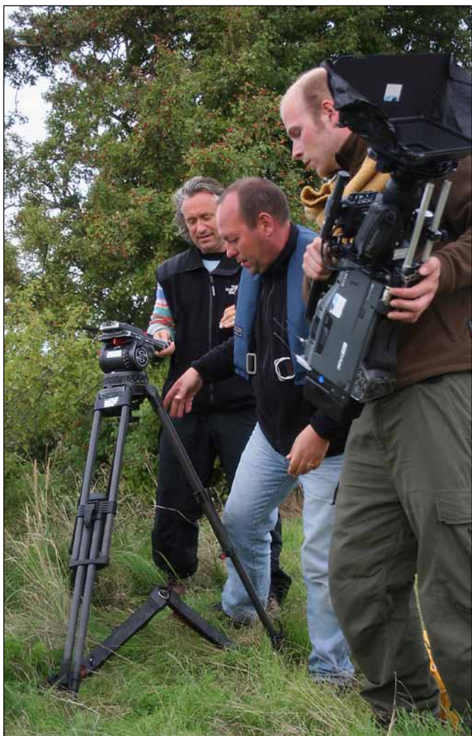
Filmholdet i aktion