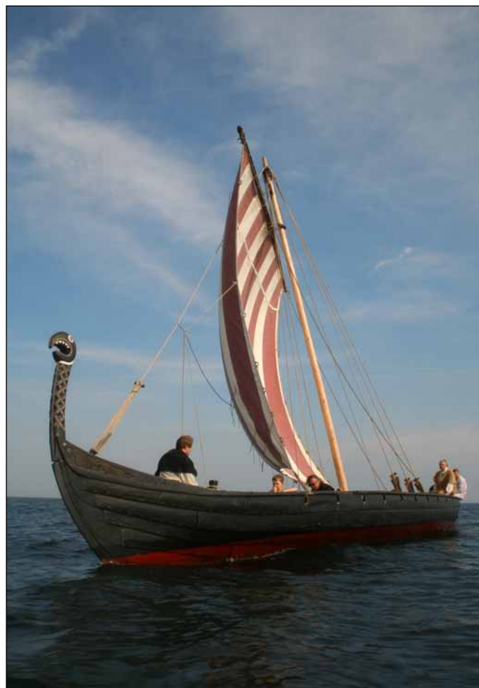
Sebbe - en lidt anden vinkel