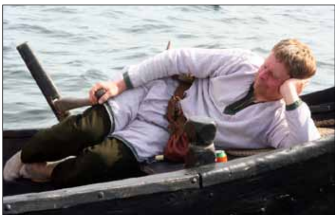
Hvem siger at styrmanden ikke skal nyde livet?