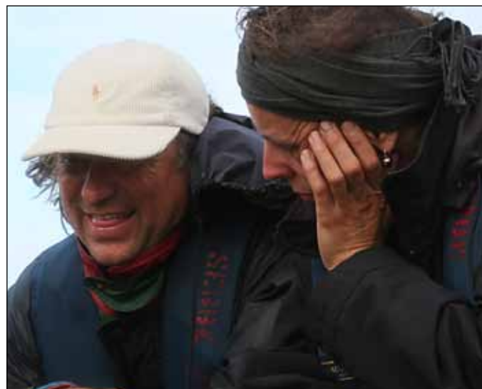
Producer og assistent