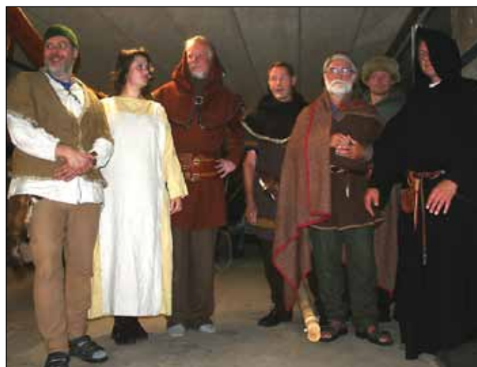
Så er statisterne klar