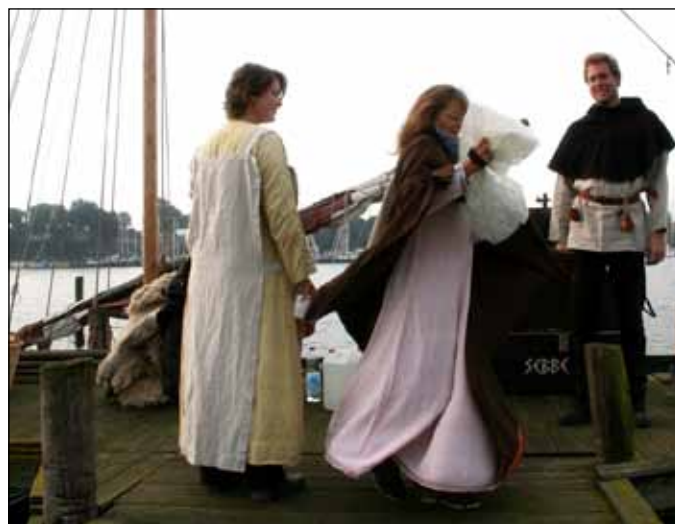
En sving om før det går løs