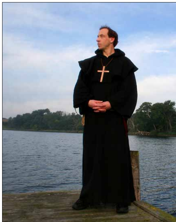
Ensom munk taler med sin Gud.