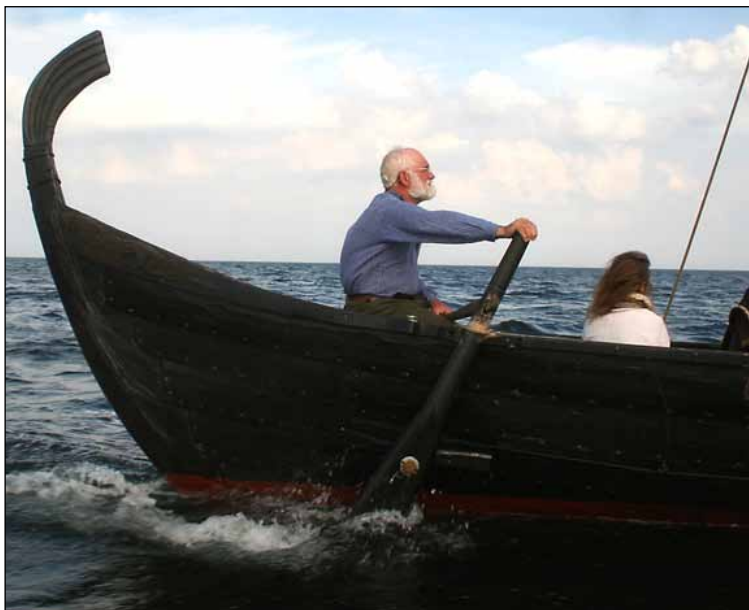
Skipper og styrmand nød den gode vind og farten