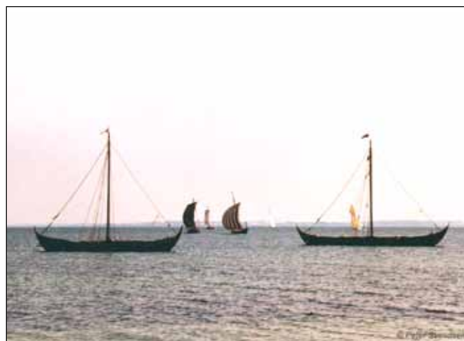
Der blev sejlet og hygget