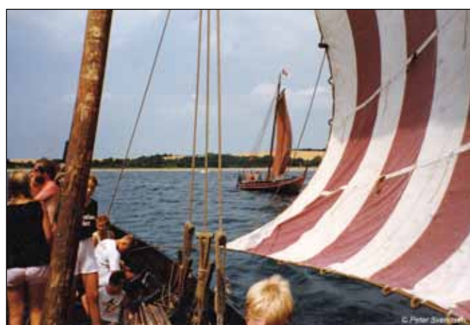
Sejlads med skibene