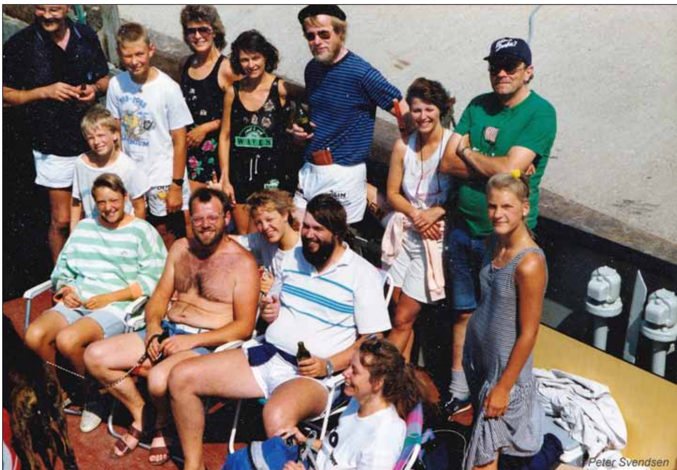
Familiefoto af en del af deltagerne