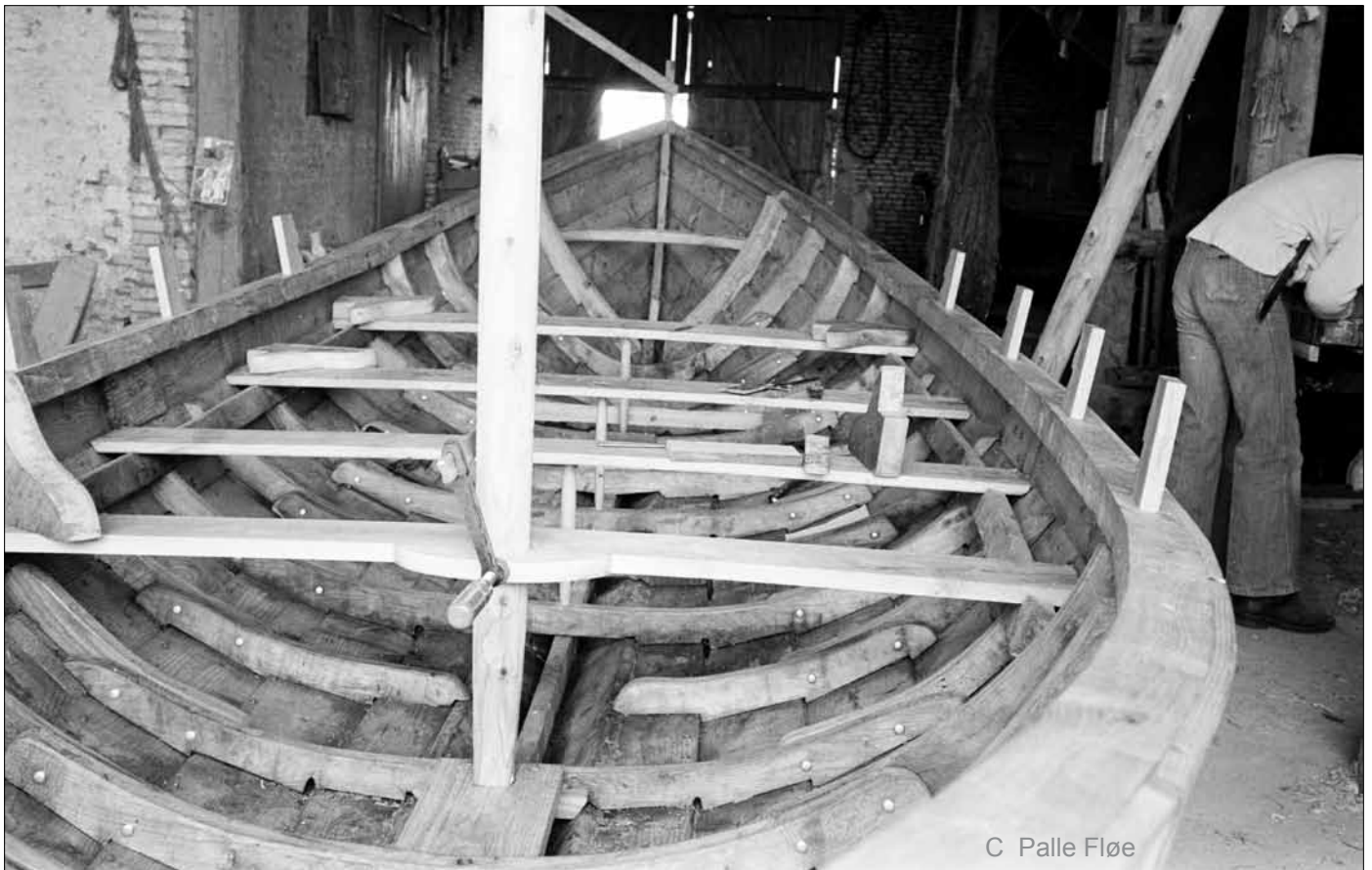
De sidste knæ tilpasses