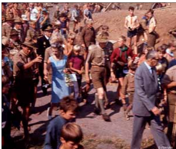
Kong Frederik og dronning Ingrid