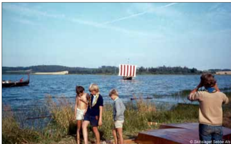
Sebbe sejler som eneste skib og imponerer kongen

Sebbe Als blev halet op på blokvognen igen nogle dage efter og transporteret til Augustenborg. Første tur - jomfrurejsen - var slut.