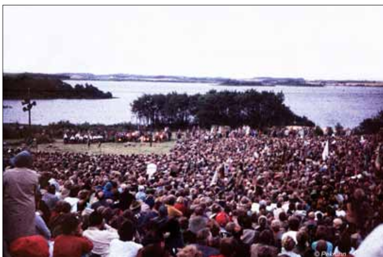
Så er der samling på pladsen