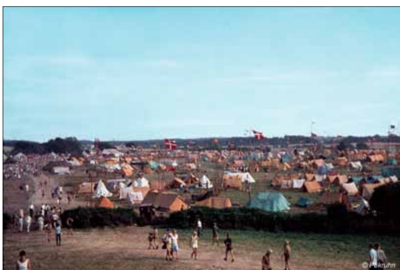
Den store teltlejr