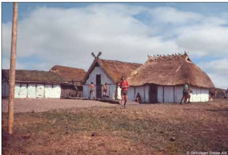
Handelsbyen Ny Hedeby