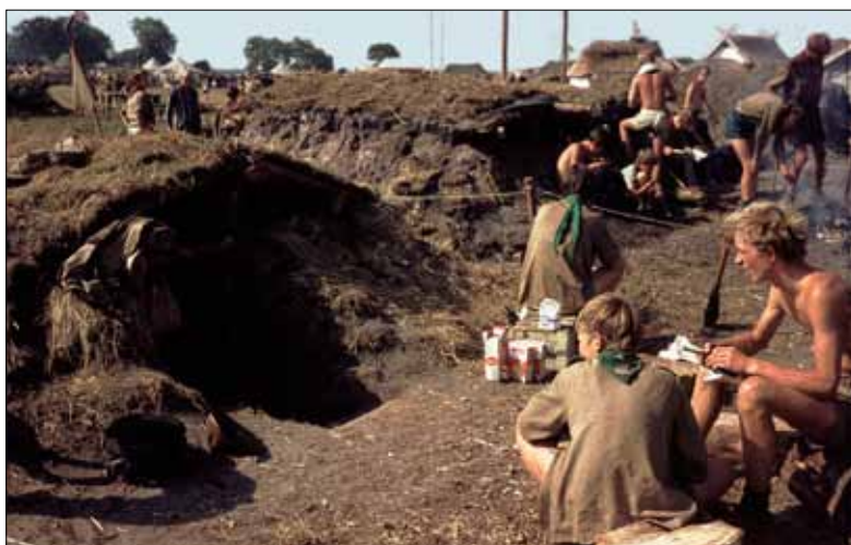
Der var bygget en lang række landnamshytter