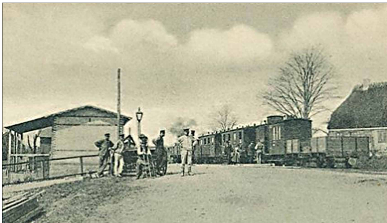
Jernbanen i Hundsløv. Toget holder på stationen i Hundsløv (Trinbrædtet)