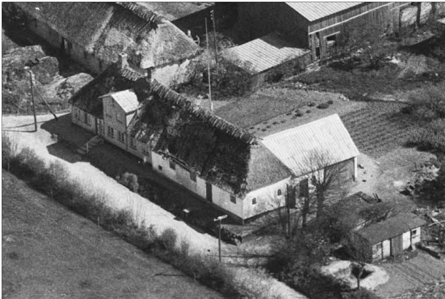
Kätnerhof/ Uhrmacher Bleshøj 1939