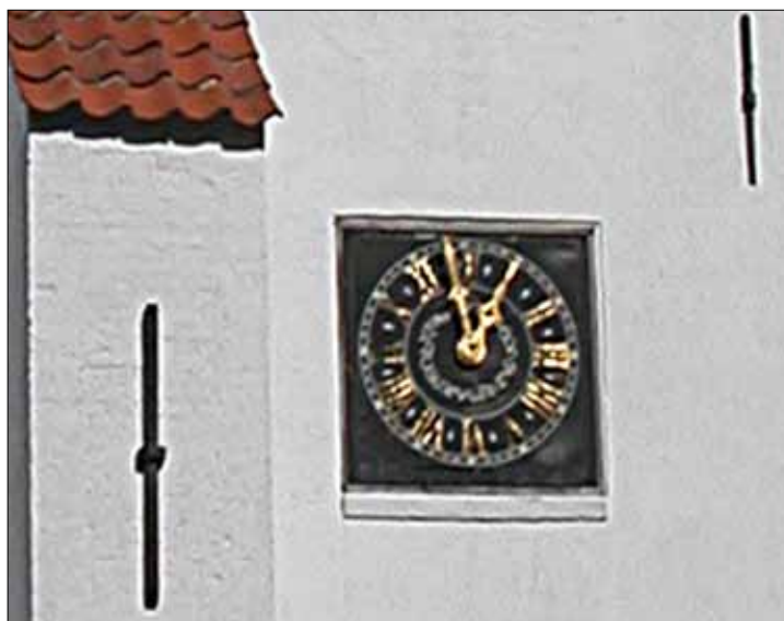
Die Uhr im Kirchturm