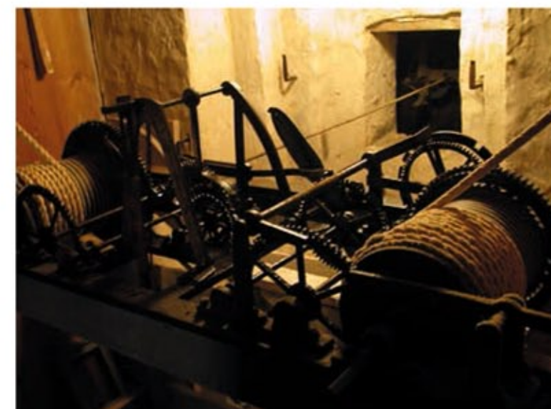
Urværket fra 1874 i kirketårnet.