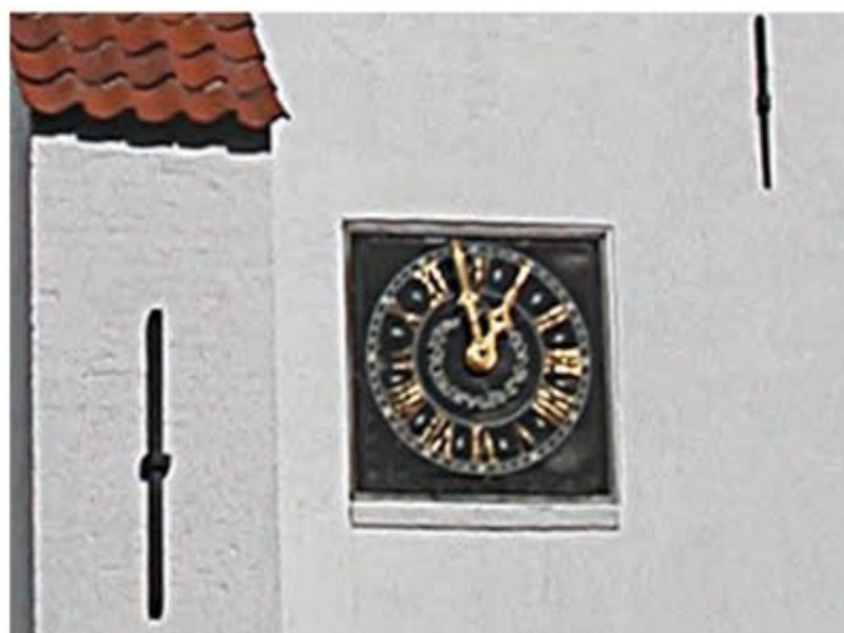
Uret i kirketårnet.