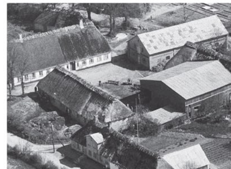
Junkergården ca. 1949.