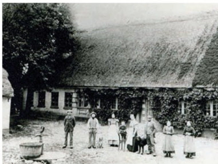
Junkergården ca. 1900.