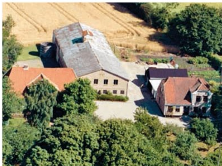
Gården 1989.