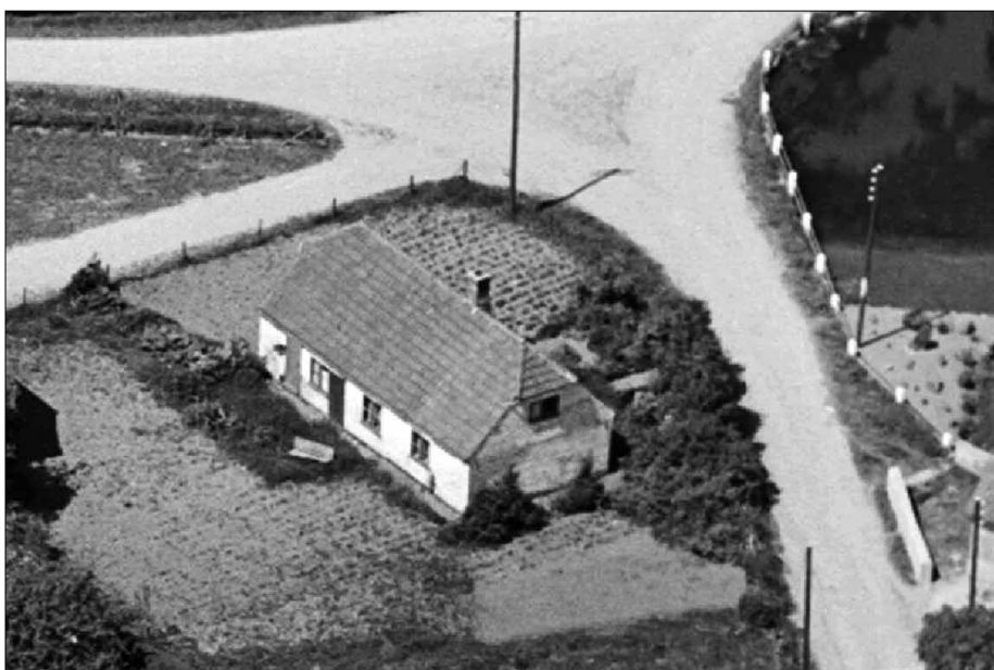
Notmark 38a, matrikel 14. 1939