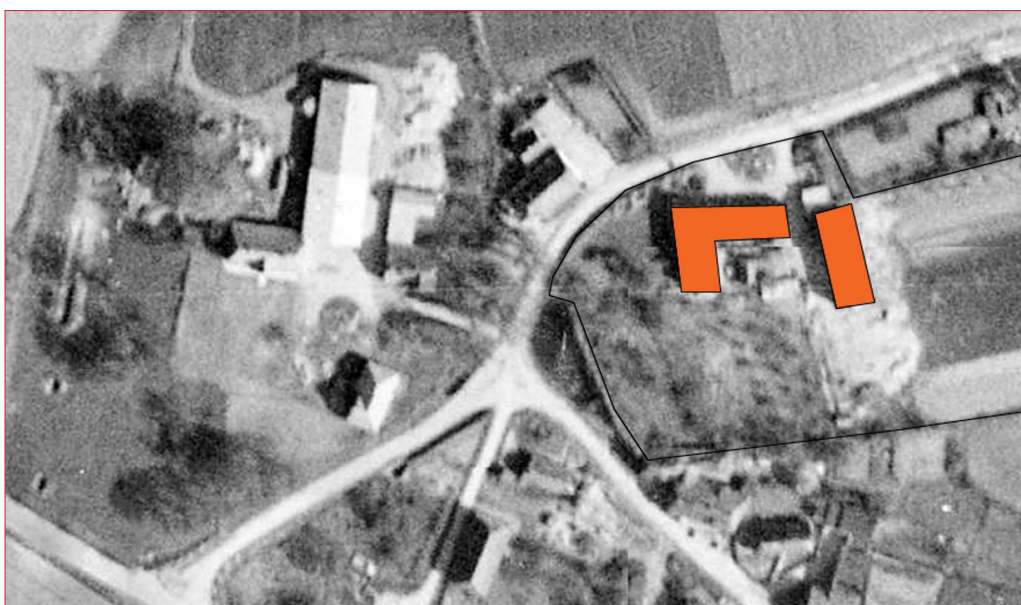
Damgård beliggende ovenfor dammen