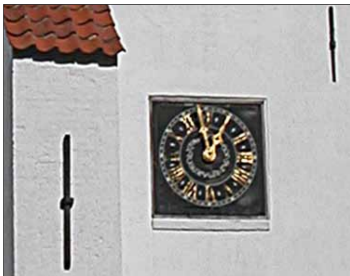
Die Uhr im Kirchturm