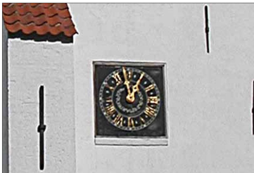
Uret i kirketårnet