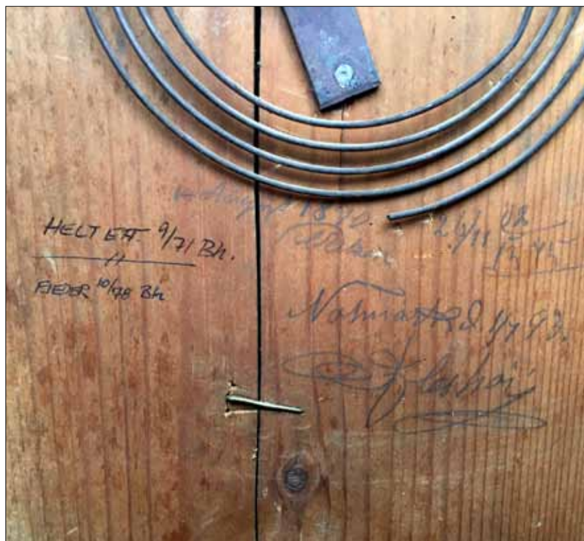
Bagsiden af uret

Helt EFT (efterset) 9 / 7 Bh (Bleshøj) 26 / 11 1875 Fjeder 10 / 78 (1878) Bh (Bleshøj) Reparation 1890 Notmark d. 1 / 7 93 (1893) Bleshøj