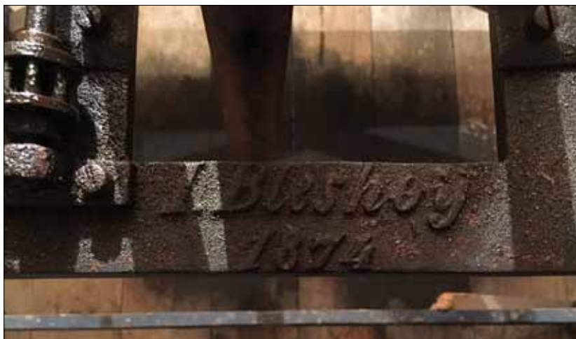
Indskriptionen i kirkeuret - I. Bleshøj 1874