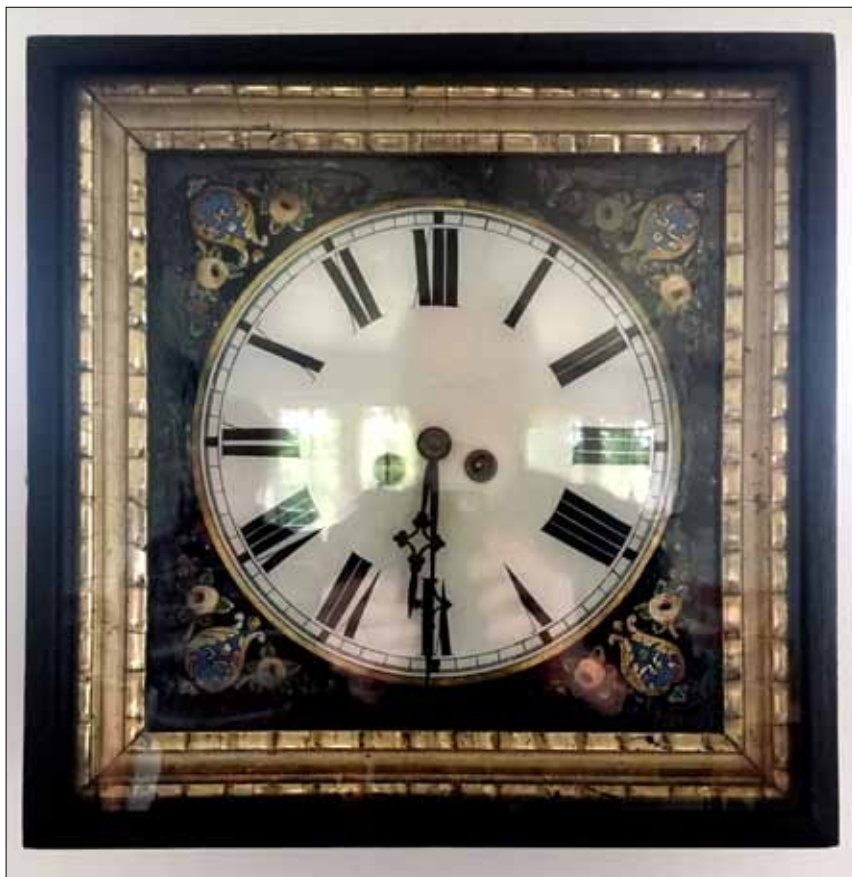
Det franske ur