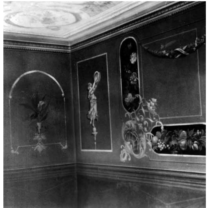
Vægmaleri fra stuen