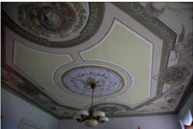
Loftmaleri i stuen