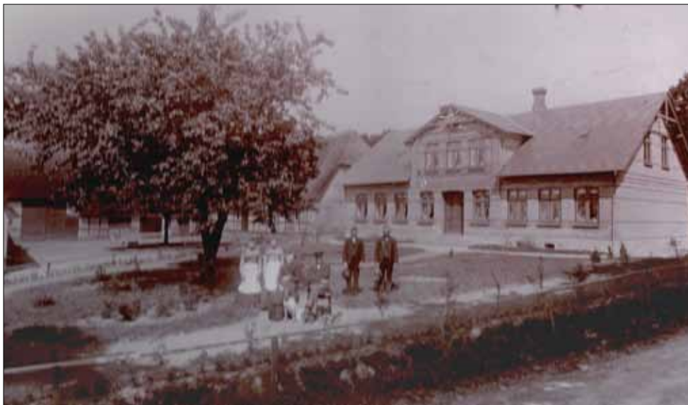
Havebjerggård efter nybygningen

Havebjerggård er det sted, hvor jeg, min far, og generationer af slægten helt tilbage til 1600 tallet har boet.