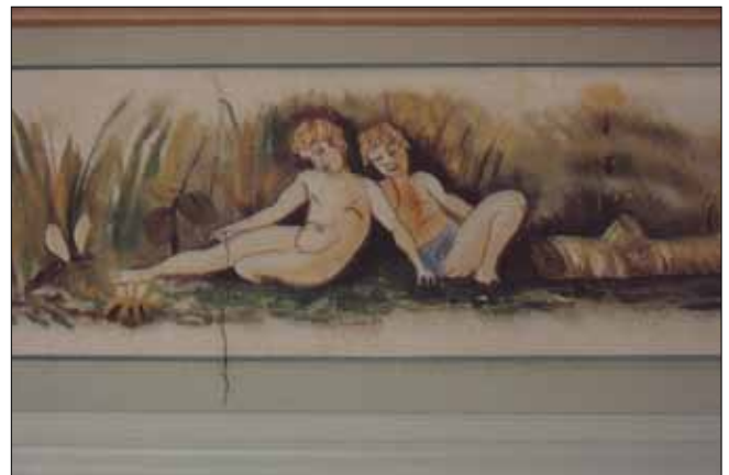
Vægmaleri (bord ved loftet)

Gulve i gangen, køkken og toilet var sek-skantede fliser i forskellige farver, tydeligt inspireret af gulvet i Notmark Kirke, som har gulve og fliser i de samme farver. Køkkenvægge var Jugendstil fliser med border. Og selvfølgelig befandt der sig et klaver i hjemmet.