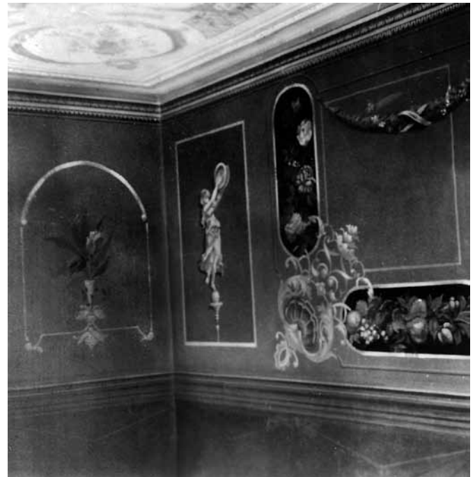
Vægmaleri fra stuen