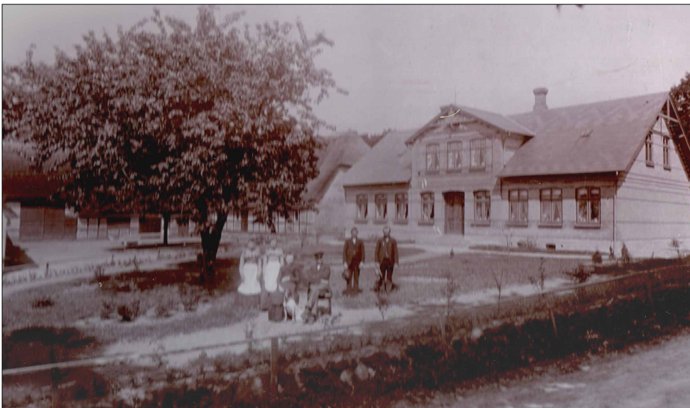
Havebjerggård efter nybygningen

Havebjerggård er det sted, hvor jeg, min far, og generationer af slægten helt tilbage til 1600 tallet har boet.