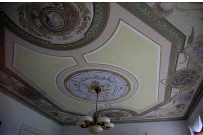
Loftmaleri i stuen