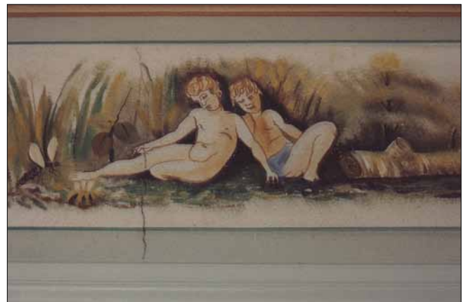
Vægmaleri (bord ved loftet)

Gulve i gangen, køkken og toilet var sek-skantede fliser i forskellige farver, tydeligt inspireret af gulvet i Notmark Kirke, som har gulve og fliser i de samme farver. Køkkenvægge var Jugendstil fliser med border. Og selvfølgelig befandt der sig et klaver i hjemmet.