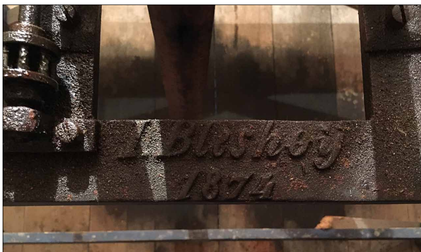
Indskriptionen i kirkeuret - I. Bleshøj 1874 - (Foto Steen Weile)