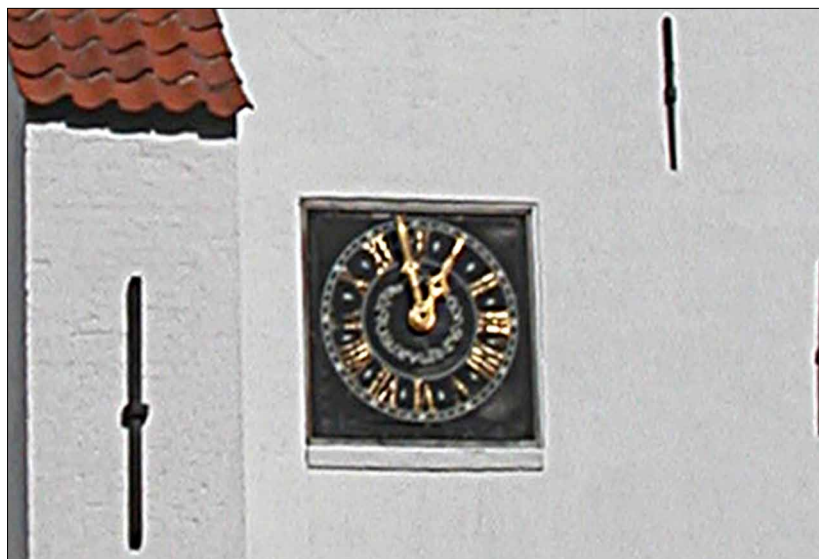
Uret i kirketårnet