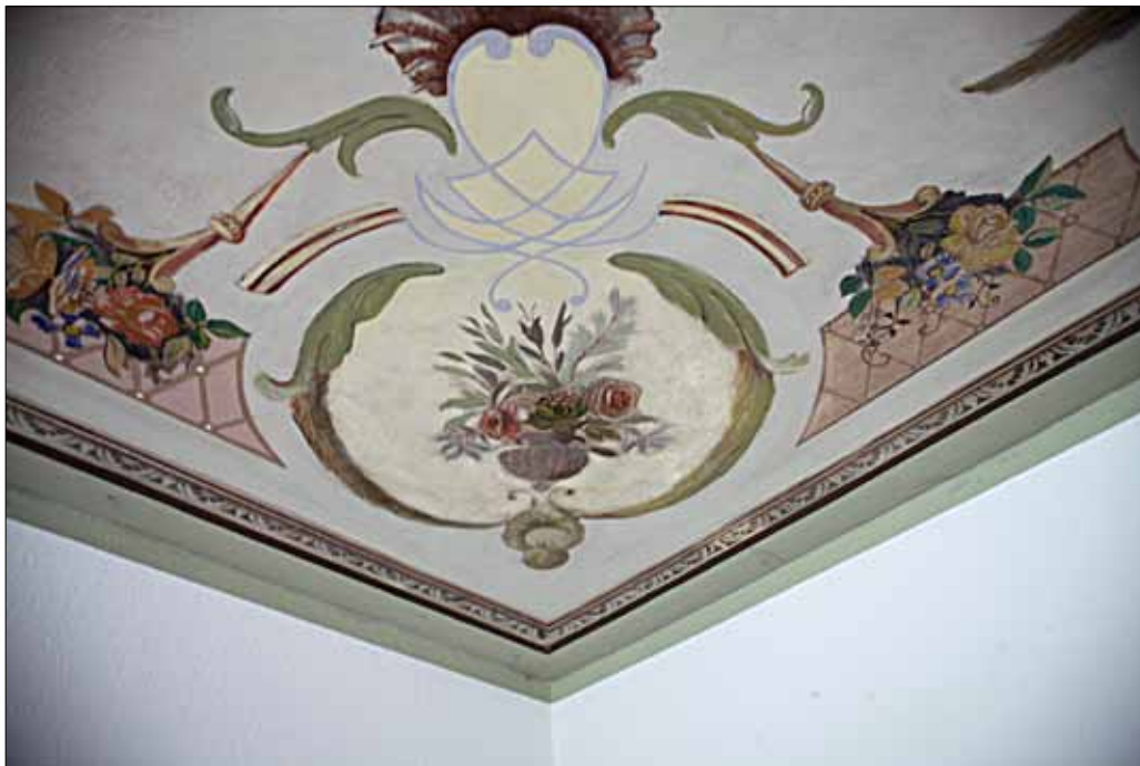
Motivet i stueloftet