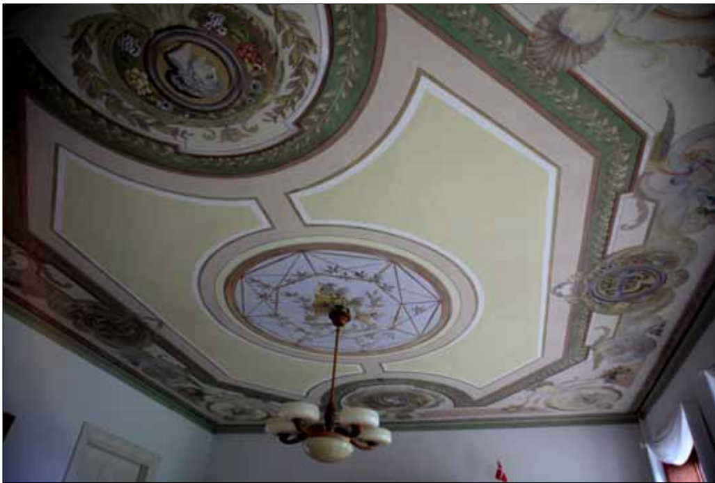
Motivet i stueloftet