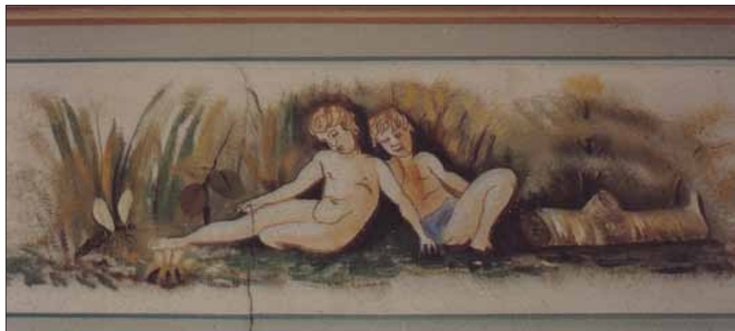
Frise over dør