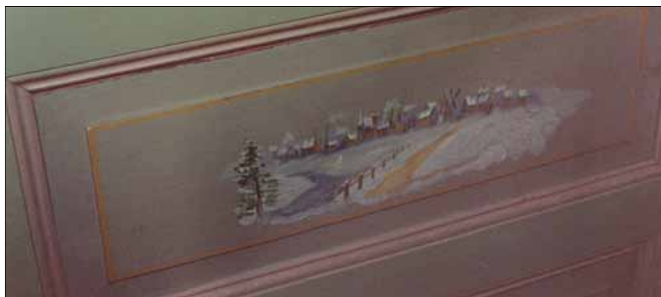
Rude fra dør i huset.