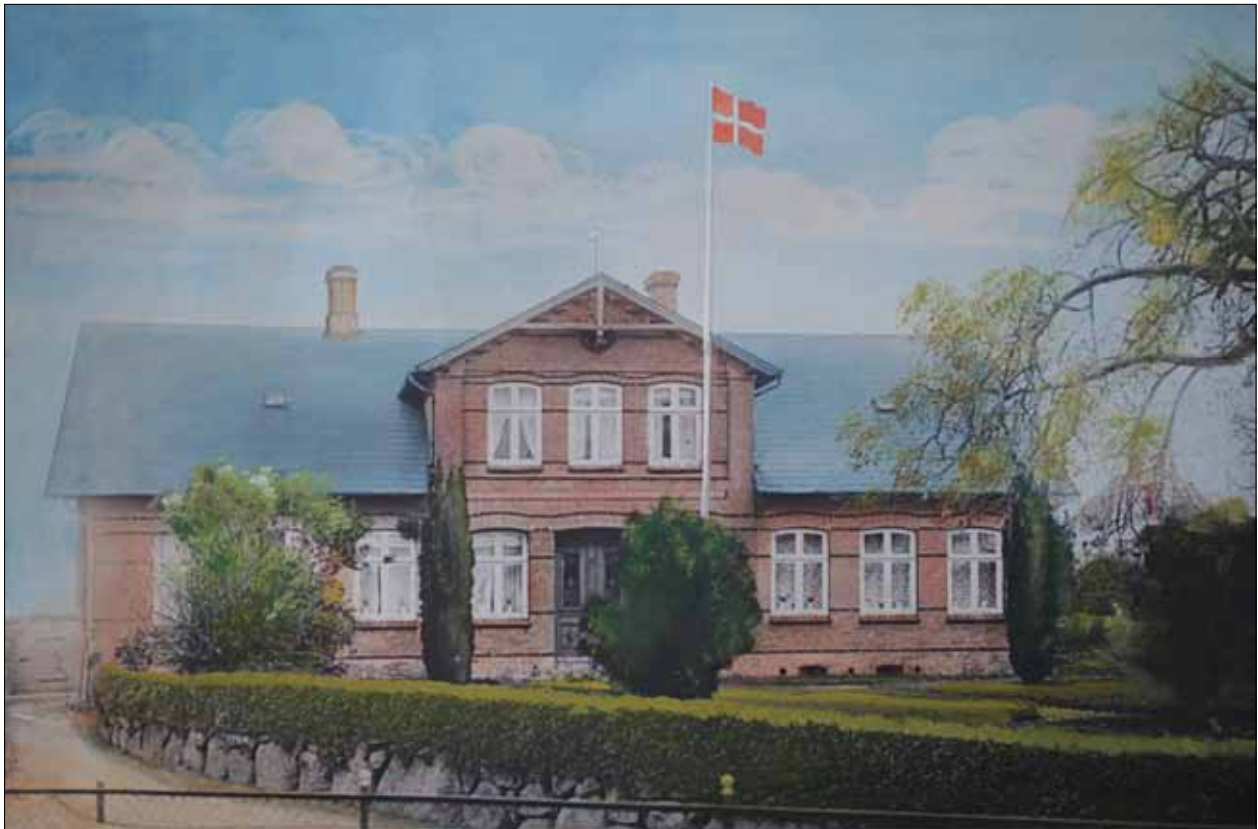
Håndkoloreret foto ca. 19xx. Flagstangen og flaget er malet på senere.