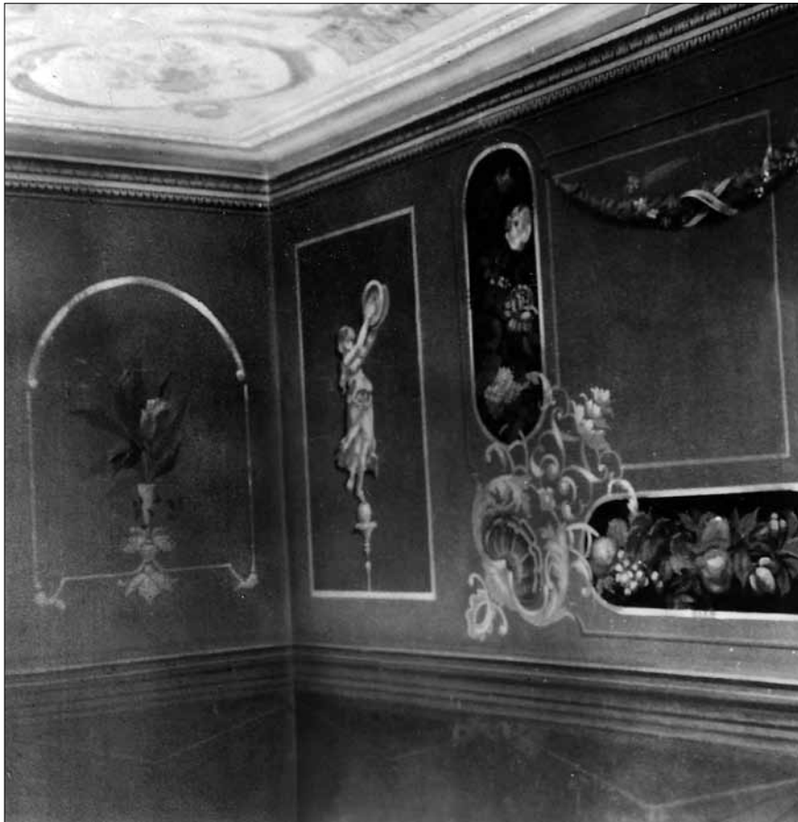
Vægmaleri i stuen