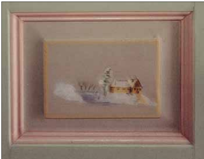
Rude fra dør i huset.