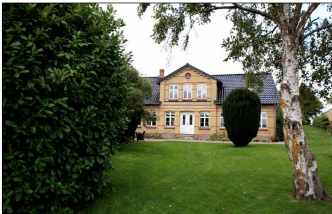
Notmark 19, stuehuset 2021