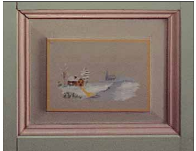
Rude fra dørei huset.