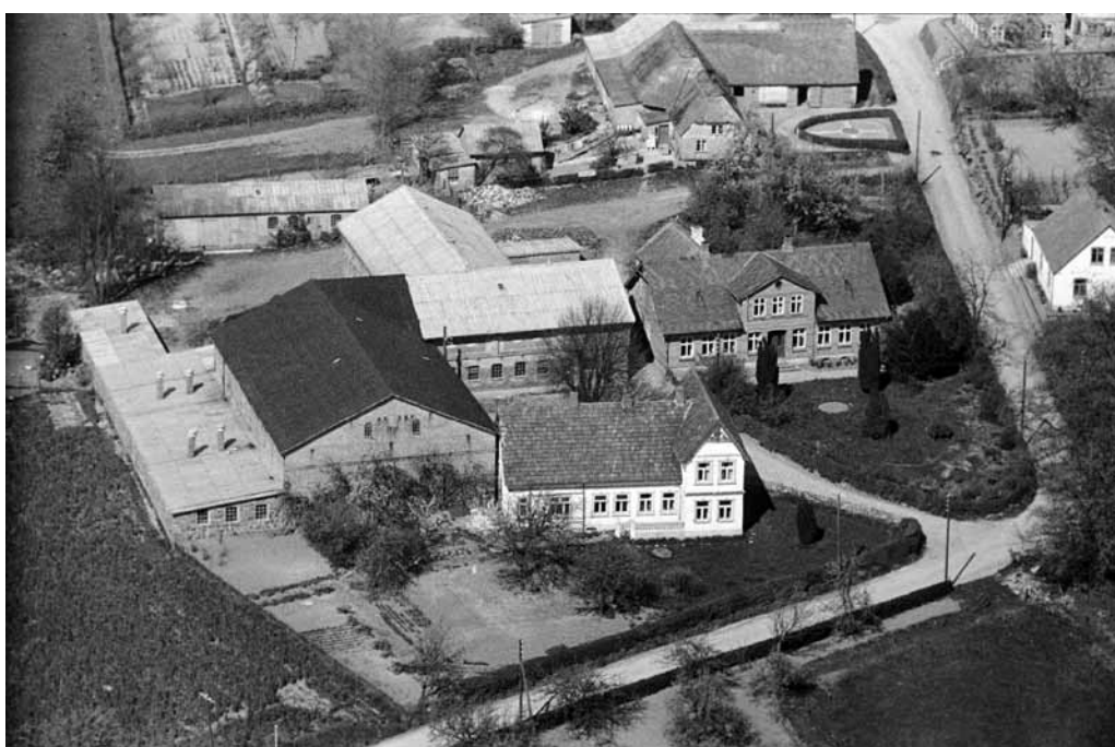
Notmark 17 og 19, matrikel 3b. Havebjerggaard. 1949 Det Kgl. Bibliotek.