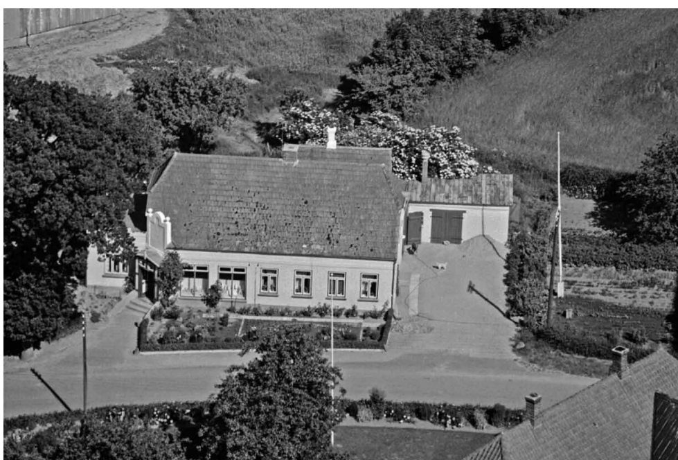
Notmark 7, matrikel 5, Lassens Høkeri. 1959