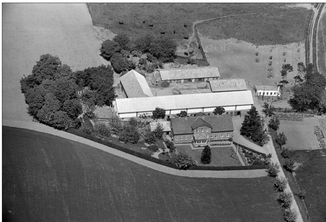
Skærtoft 2 + 4, matrikel 8. Skærtoft. 1939 Det Kgl. Bibliotek.