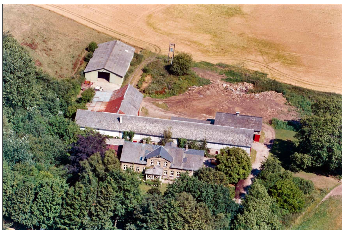
Skærtoft 2 + 4, matrikel 8. Skærtoft. 1989