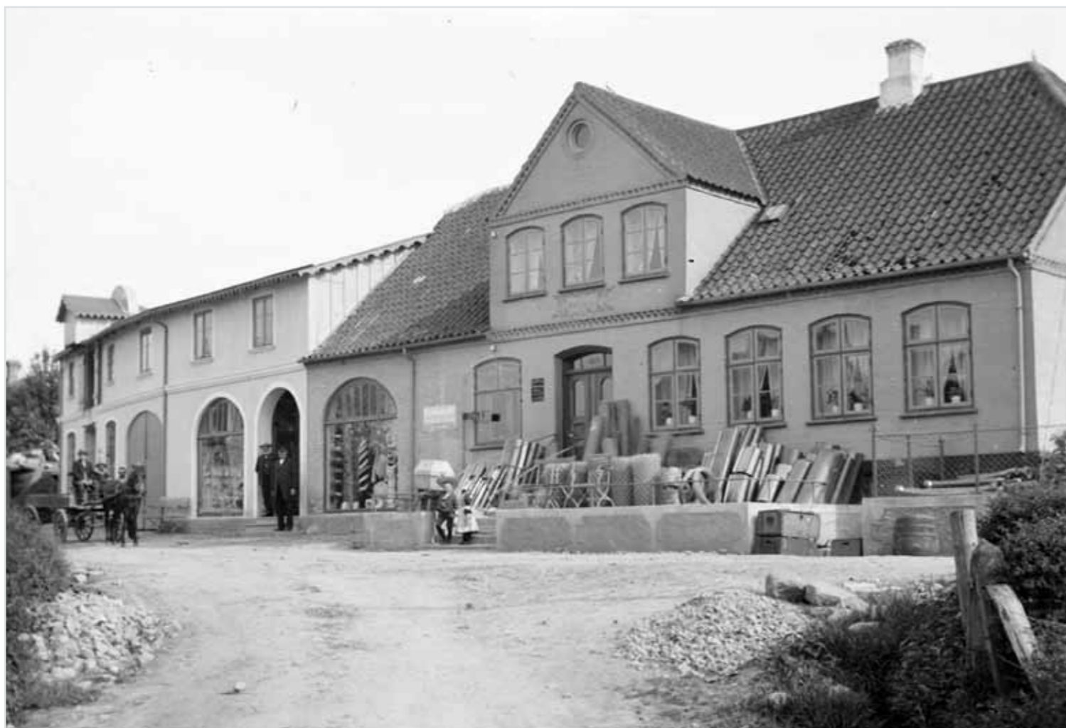
Høkeriet blev opført i 1877