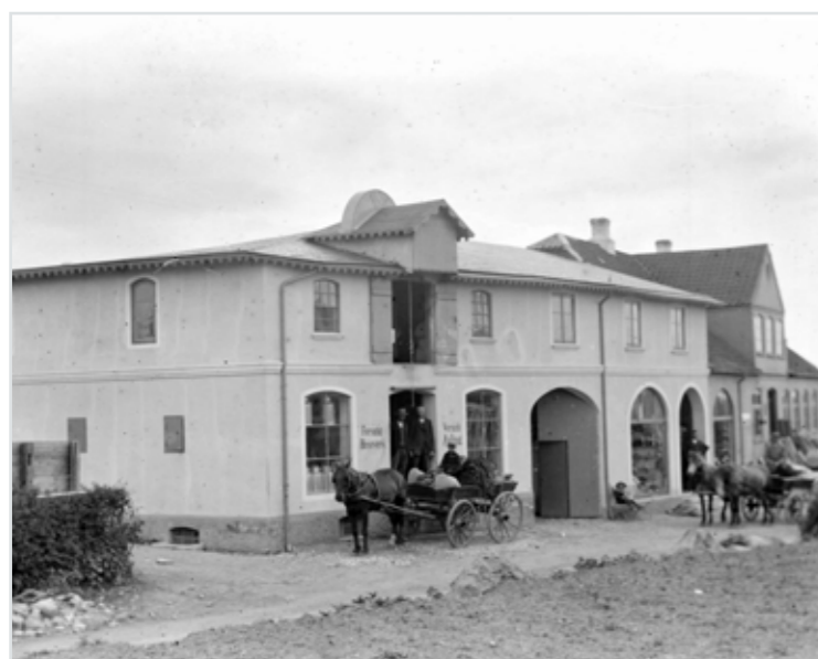
Korn læsses af ved kornfirmaet

Det blev strenge tider i 30'erne. I 1930 løb produktionen løbsk i relation til afsætnings muligheder. Man indførte derfor de bekendte svinekort der blev tildelt efter grundskyld. Det bestemte hvor mange svin et landbrug måtte levere.