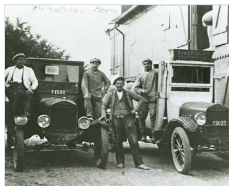
Lastbiler ved Hundslev korn