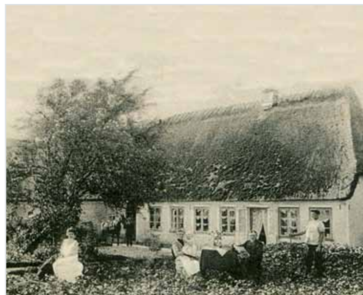
Stuehuset omkring år 1900