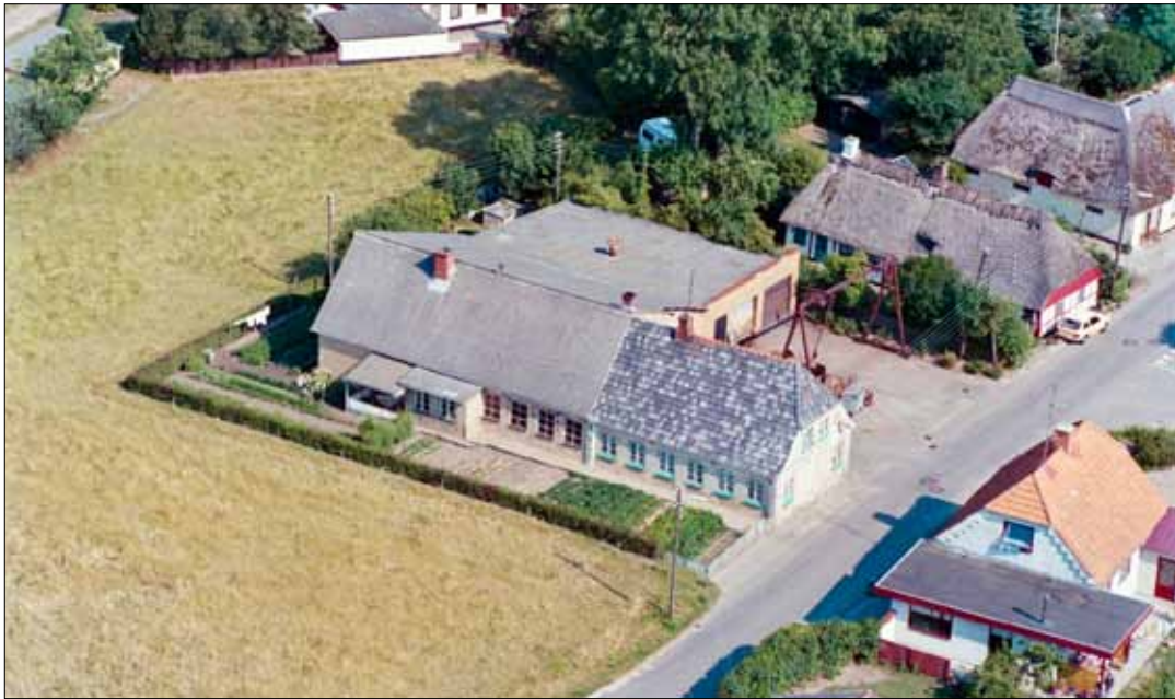
Stormarksvej 1 matrikel 48. 1989

Smede og maskinværkssted tidligere bondeinderste