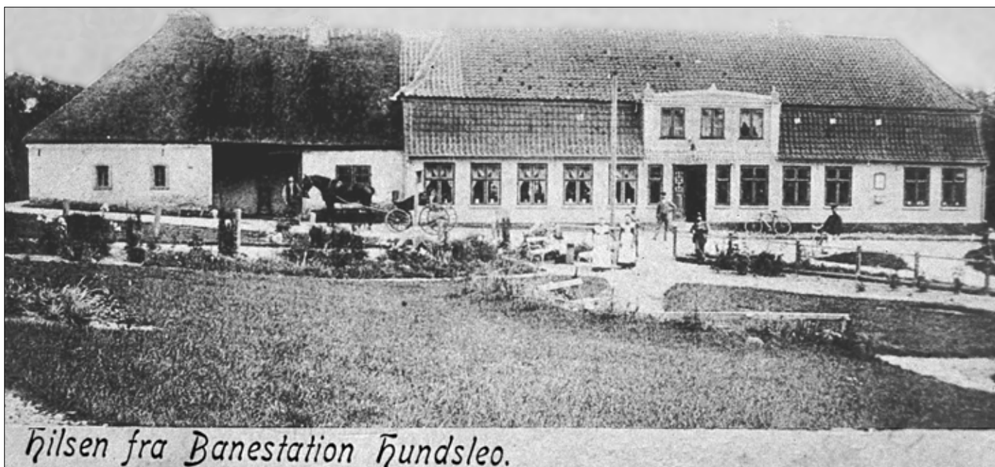
Hilsen fra Banestation Hundsleo.