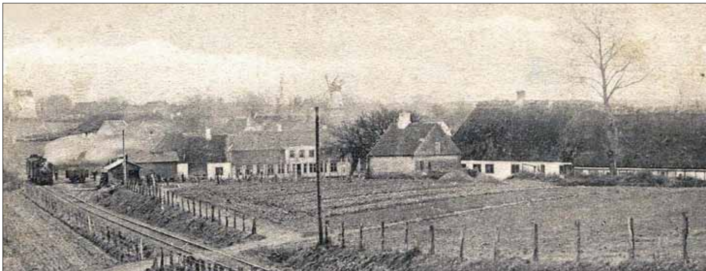
I baggrunden ses Notmark kirke, den gamle vindmølle.