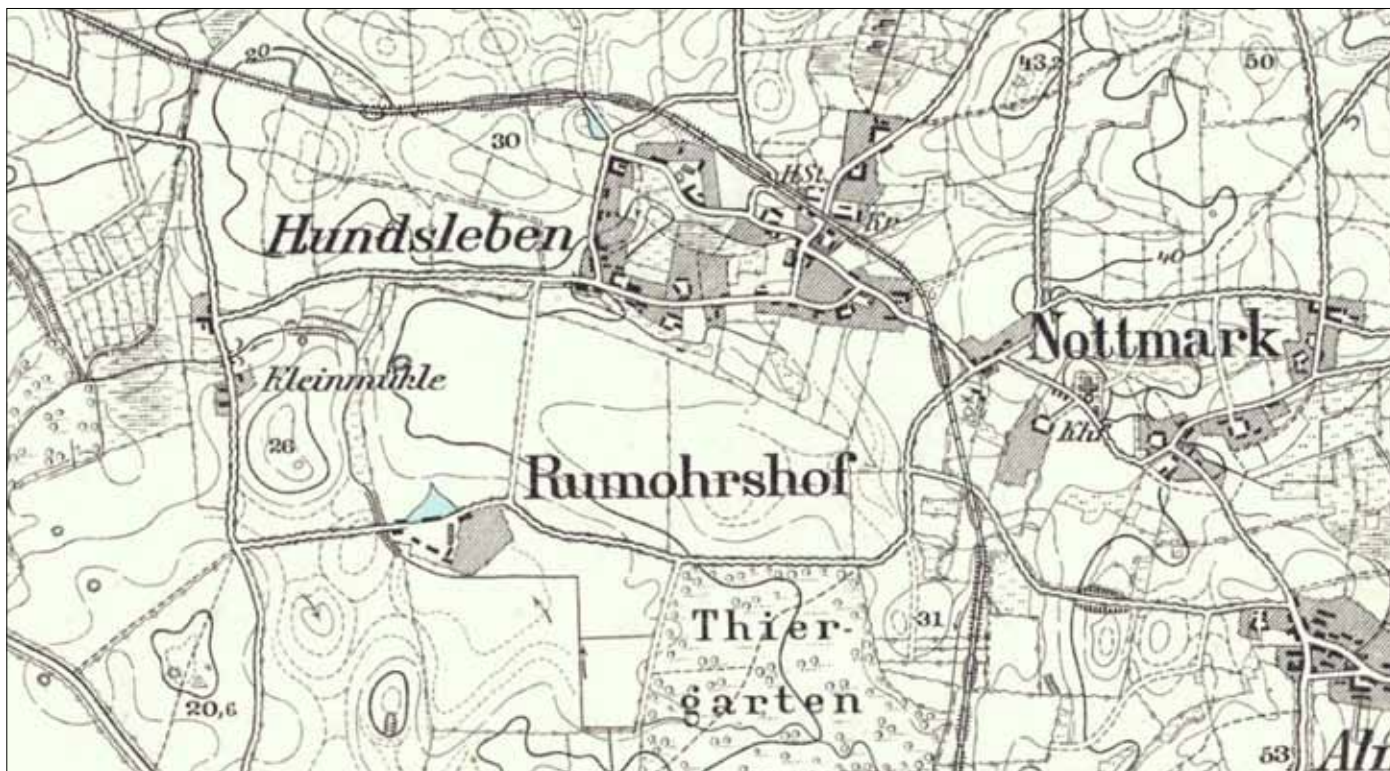
Originalkort over jernbanen i Hundslev 1900 - 1920