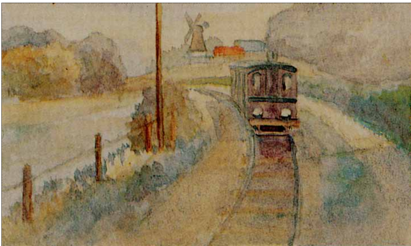
Maleri fra 16. oktober 1916 der viser toget på vej fra Hundslev mod Asserballe station. I baggrunden ses Hundslev mølle.

Maleri på postkort malet af den tyske vagtmand Max Beckert der under 1. verdenskrig boede i Asserballe og bevoktede russiske krigsfanger.