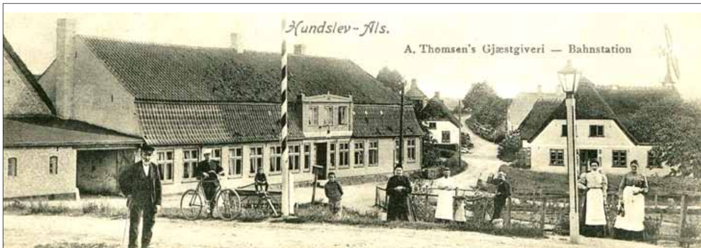
Postkort med Hundslev kro og station (1905 - 1908)