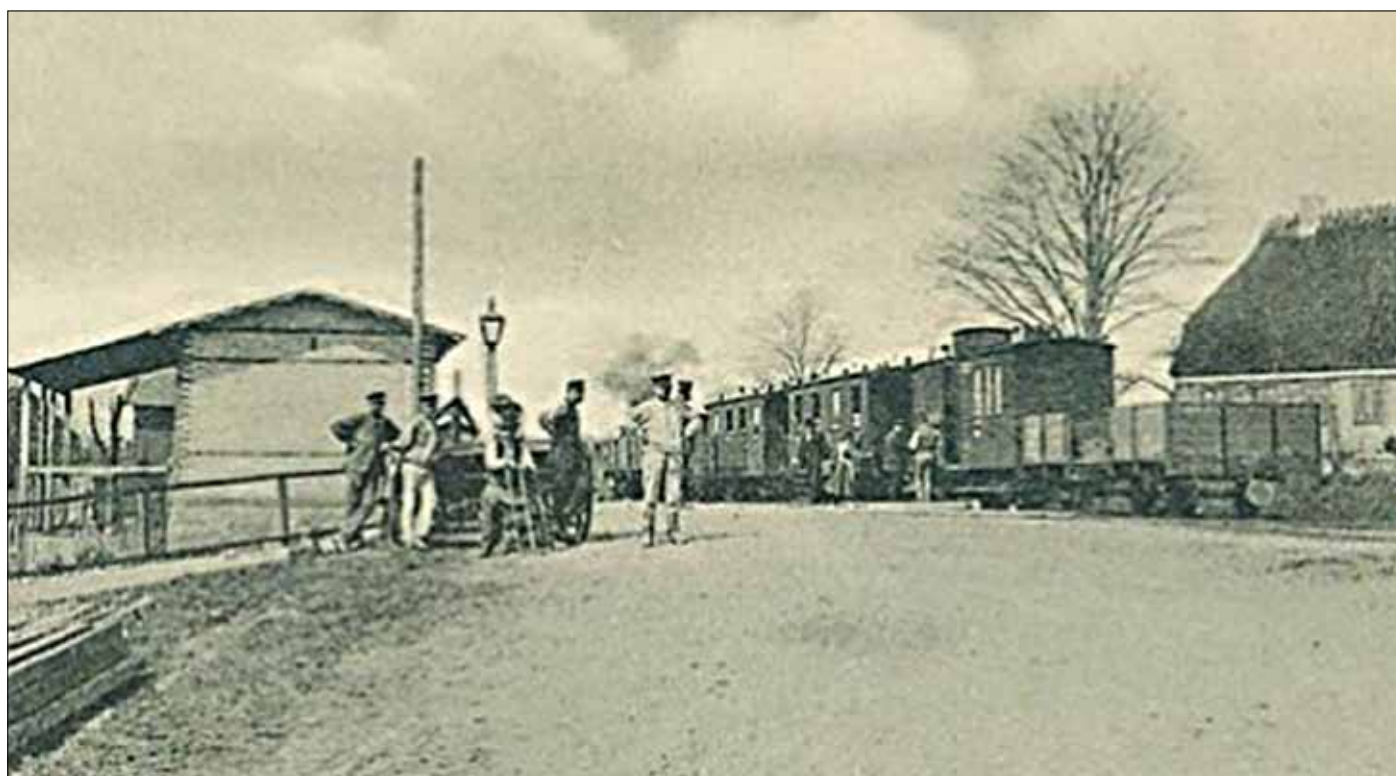
Toget holder på stationen i Hundslev (Trinbrædtet)