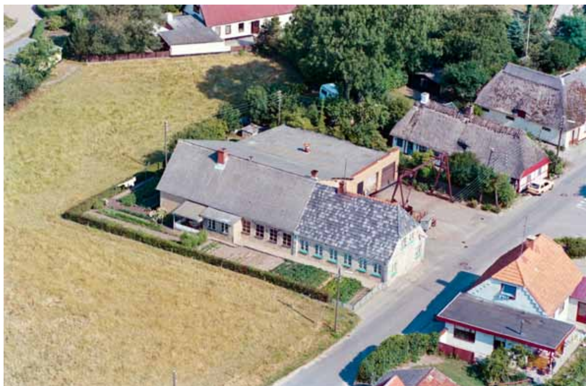
Stormarksvej 1 matrikel 48. 1989