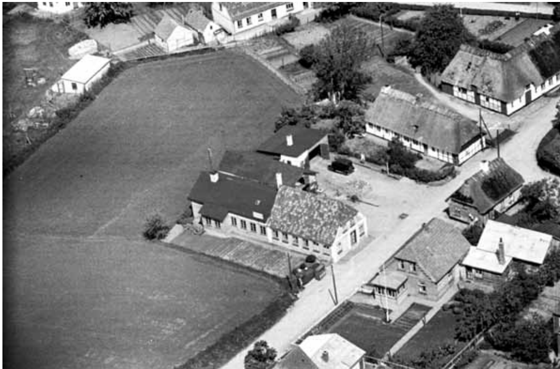
Stormarksvej 1 matrikel 48. 1948 - 1952

Augustenborg herreds skyld og panteprotokol folio 192 + 1960 +