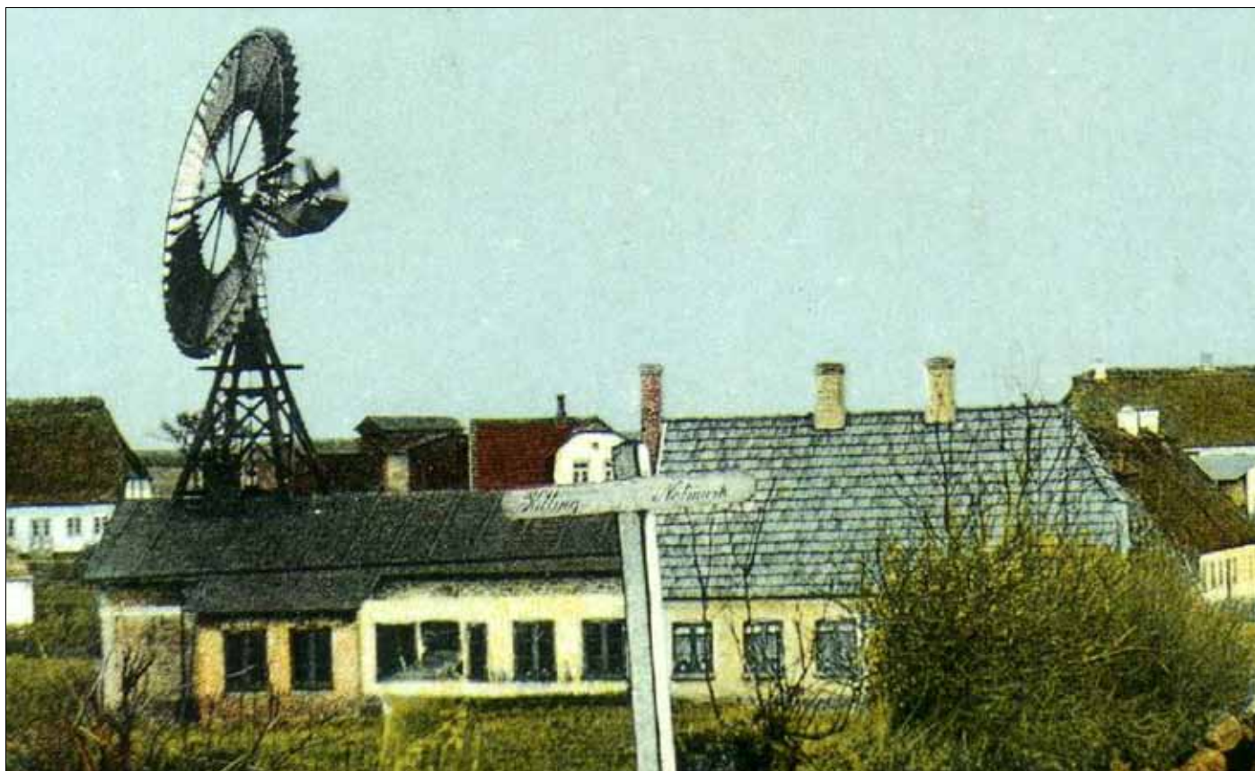
Vindmøllen og savværket blev byggede i 1870erne