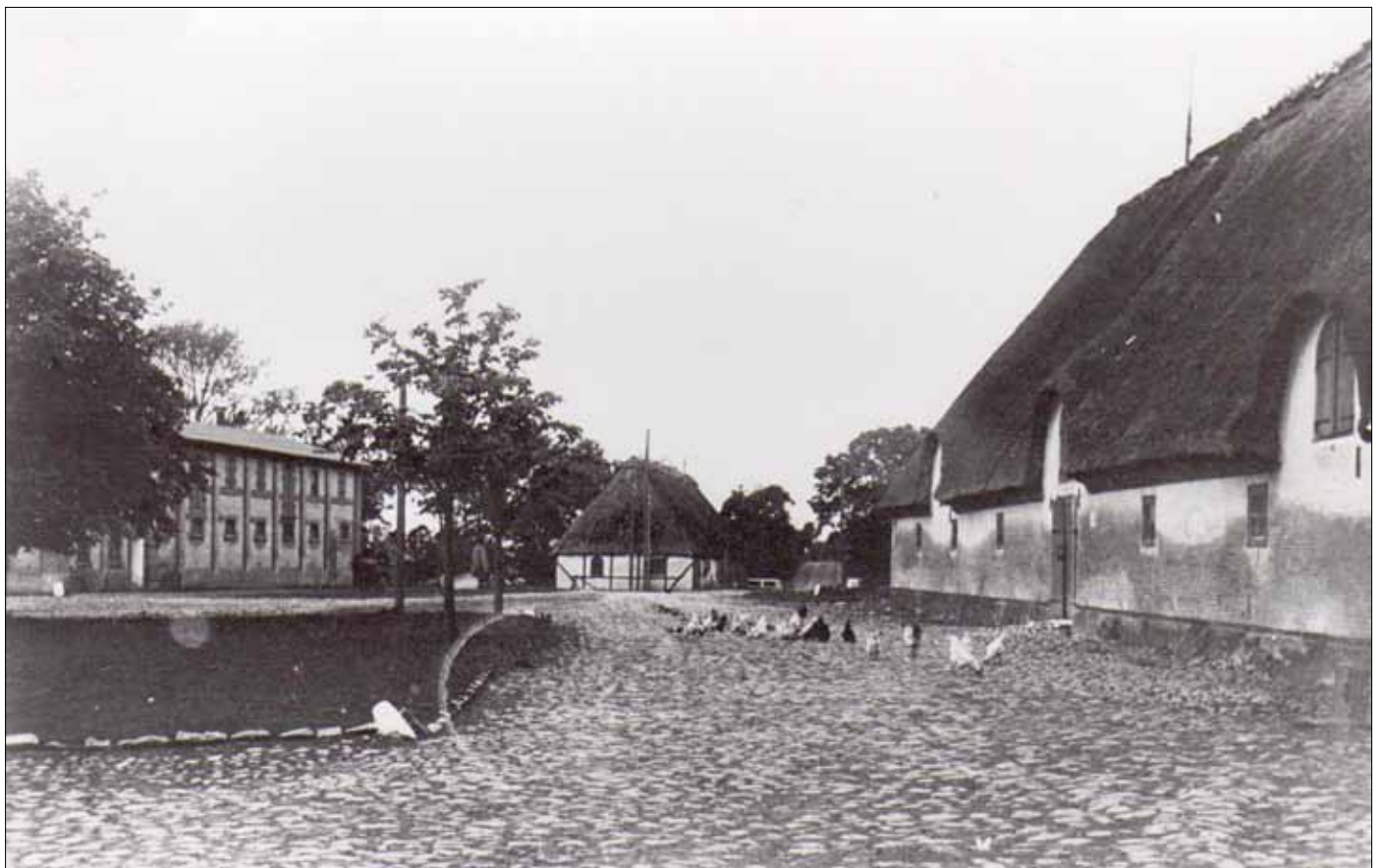
Rumohrsgård omkring 1920.