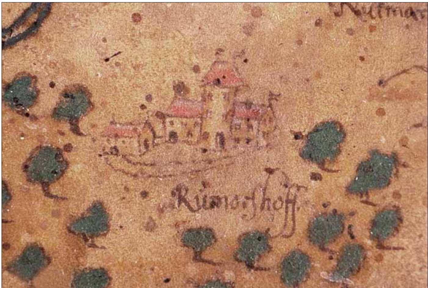
Tegning af Rumohrsgård 1655. Henrich Ottendorff.