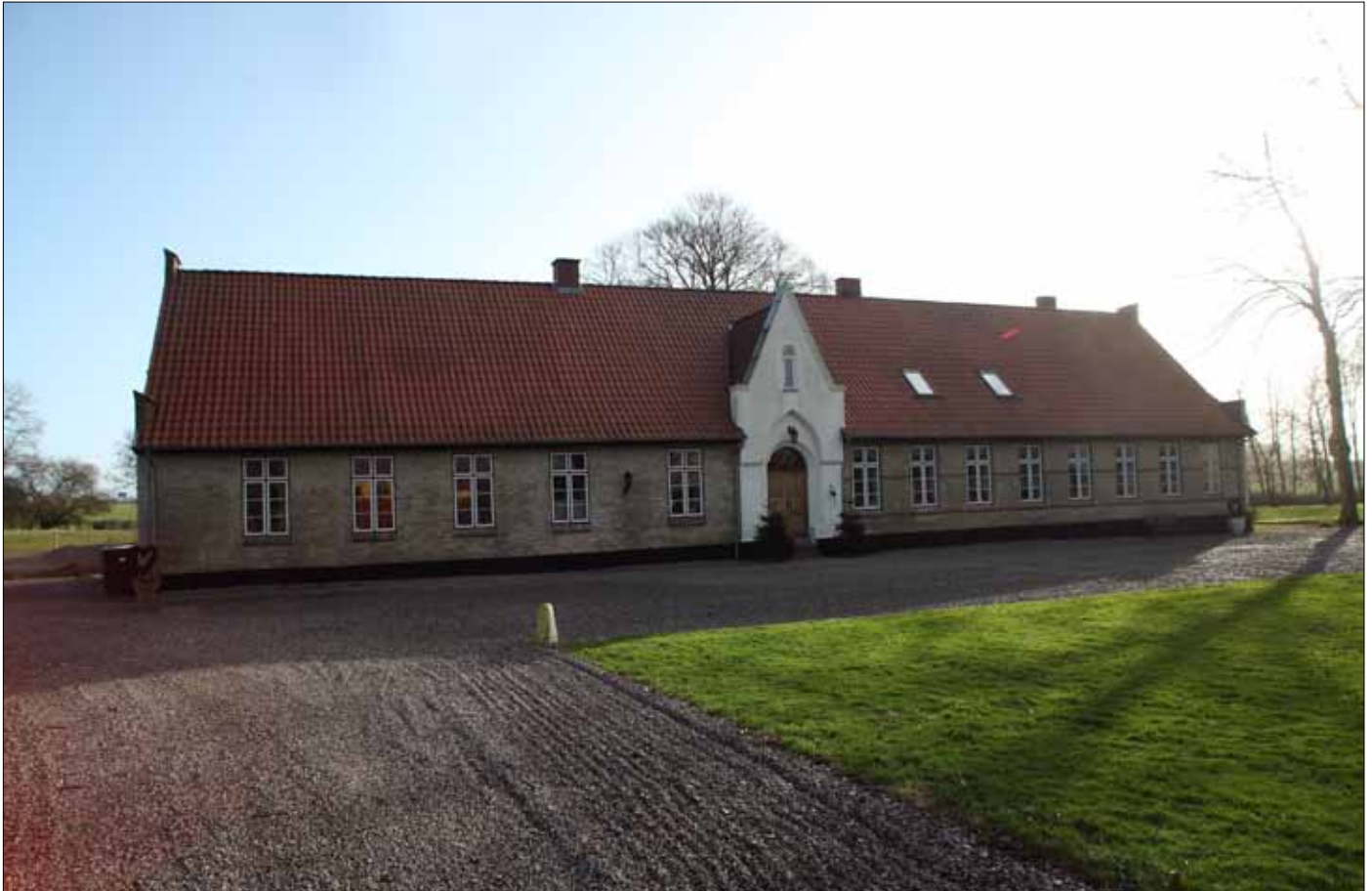
Rumohrsgård 2022 (Steen Weile)