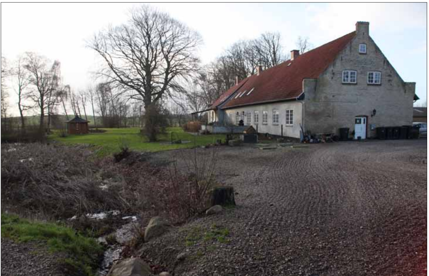
Rumohrsgård 2022 (Steen Weile)