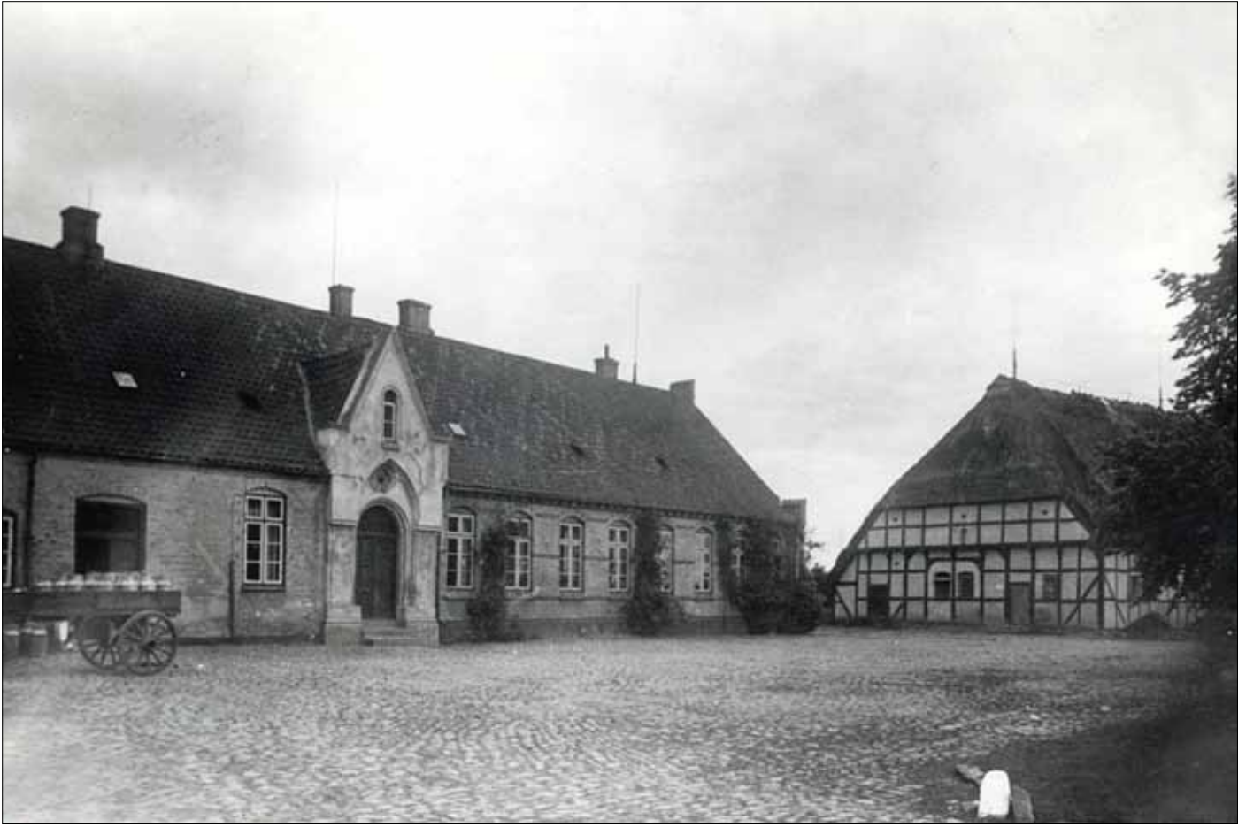
Rumohrsgård omkring 1920. (Lokalhistorisk arkiv Augustenborg og omegn).