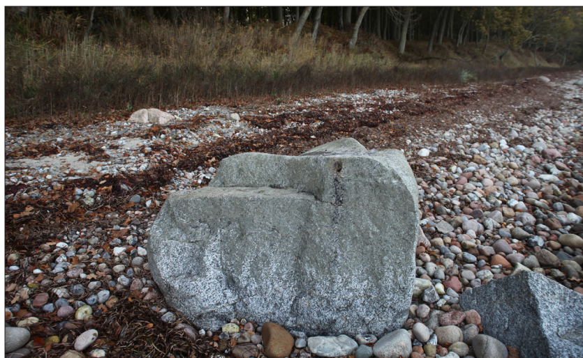
Stenen ligger frit på stranden, men der er ingen spor af det omtalte bådhus.