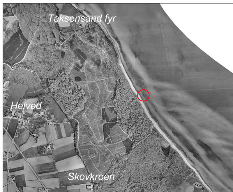
Stenens ca. placering (den røde ring)