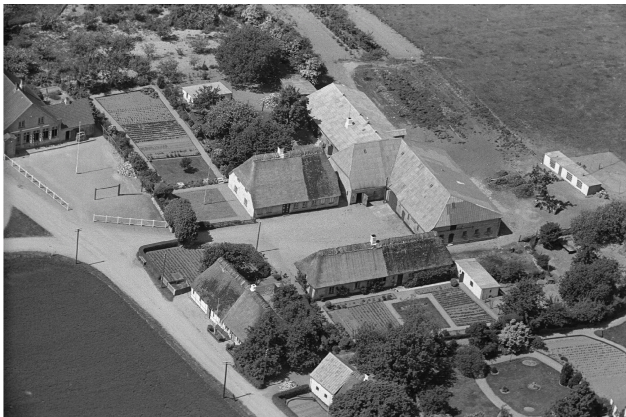
Helved 9, 1939