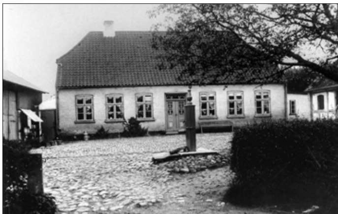
Stuehuset (årstal ukendt)