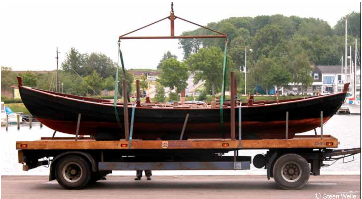
Placeret og godt fortøjet - klar til afgang.