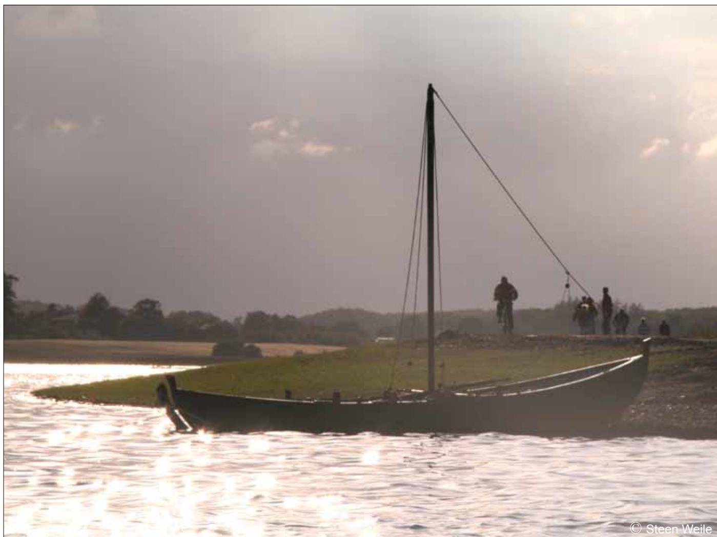
Ottar trykket op på stranden i den lavvandede sø.