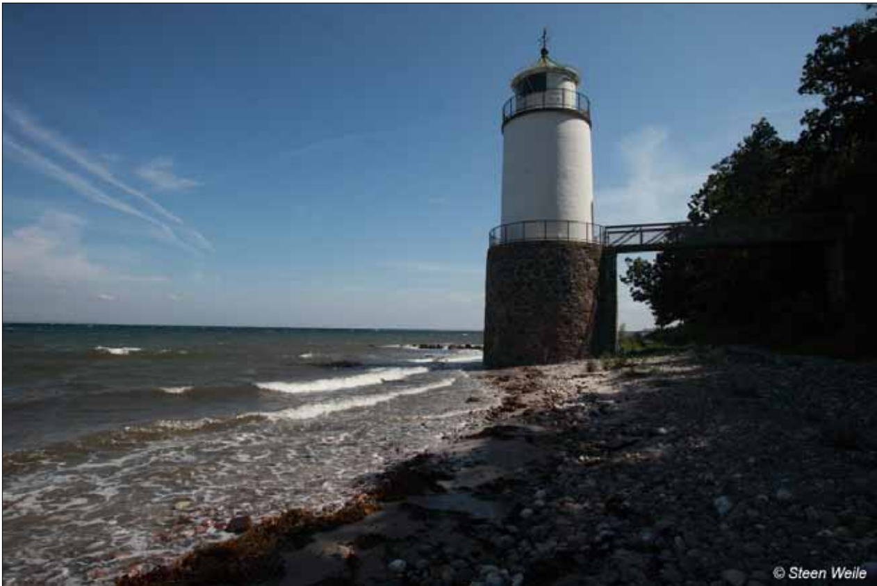
Billede af fyrtårnet som det ser ud i dag.