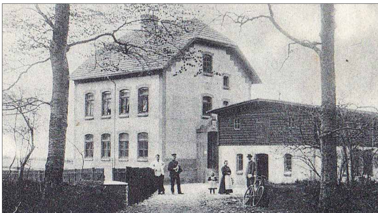
Billede af fyrmesterboligen. Boligen samt udhuse er nu nedrevet.