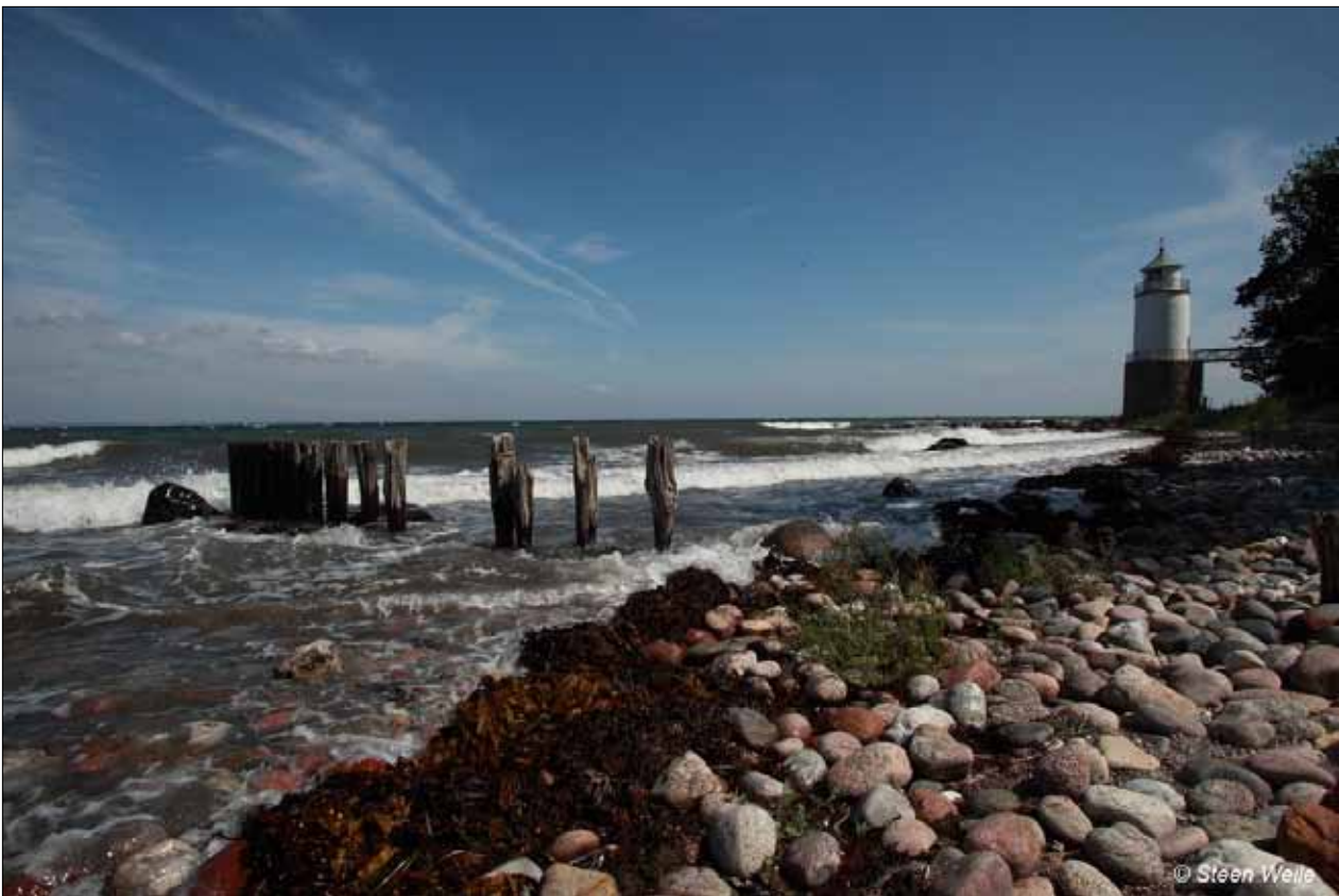
Billede af fyrtårnet som det ser ud i dag.