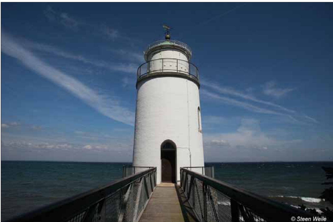
Billede af fyrtårnet som det ser ud i dag. Der er kun adgang efter aftale med fyrmesteren.