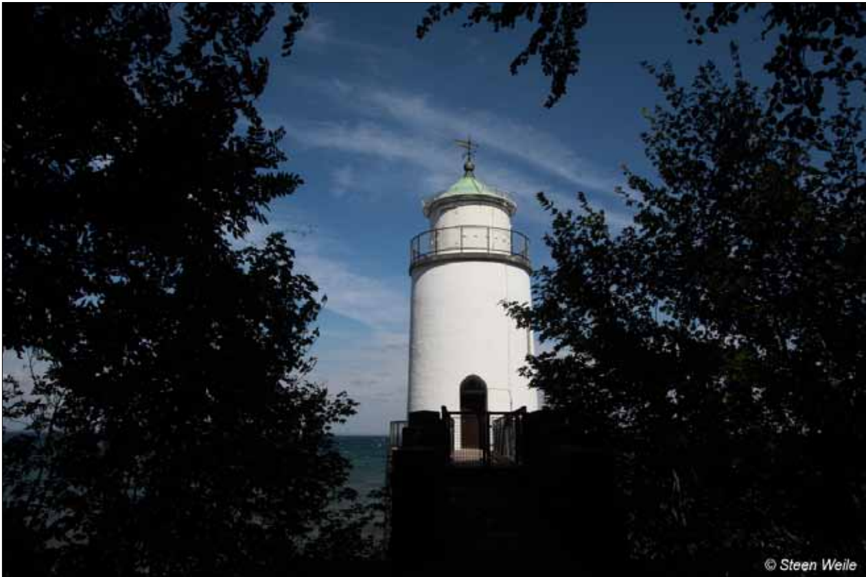
Fyrtårnet som det ser ud i dag, mellem skoven og Lillebælt.