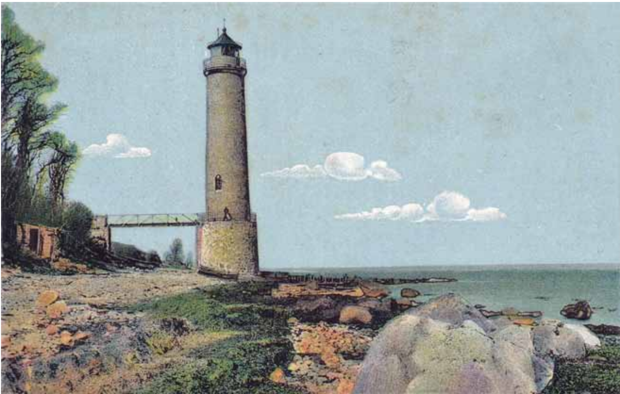
Billede af det oprindelige fyrtårn.