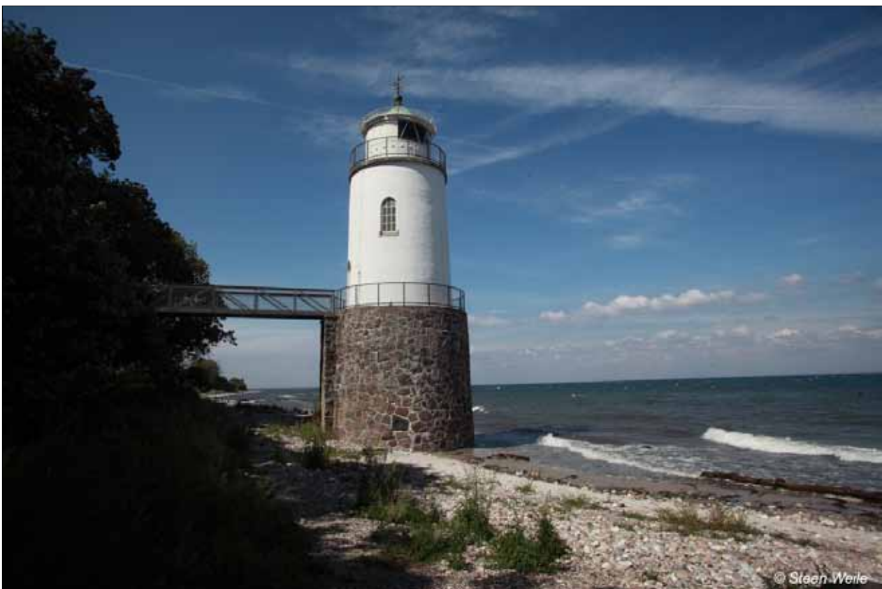
Billede af fyrtårnet som det ser ud i dag, smukt og velholdt.