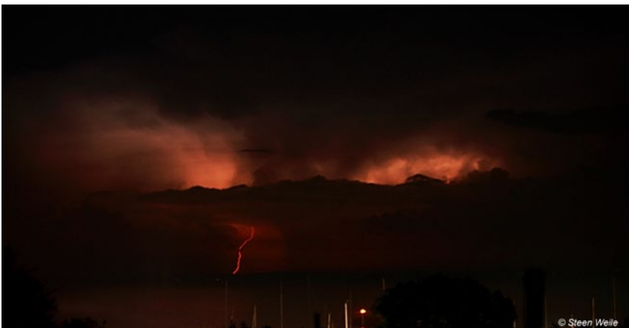
Kornmod set fra Lillehave