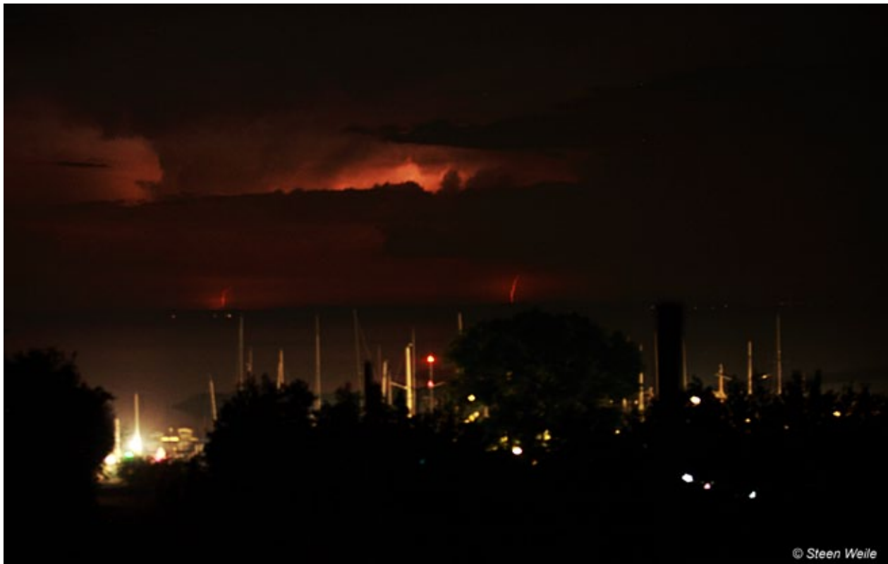
Kornmod set fra Nedergade ud over lystbådehavnen