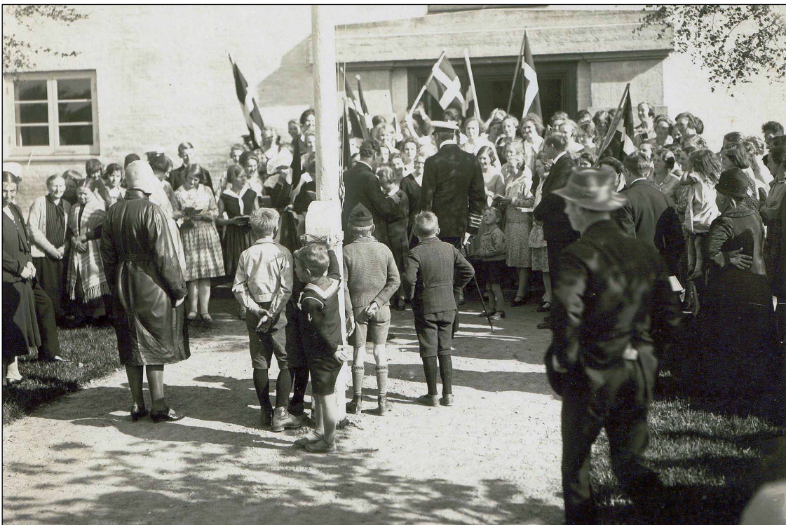
Kongen ved Danebod højskole