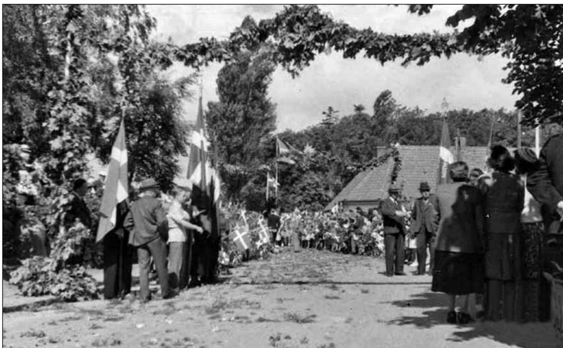
Der var folk og Danebrogstflag overalt da Kongen gik fra højskolen mod den tidligere boghandel.