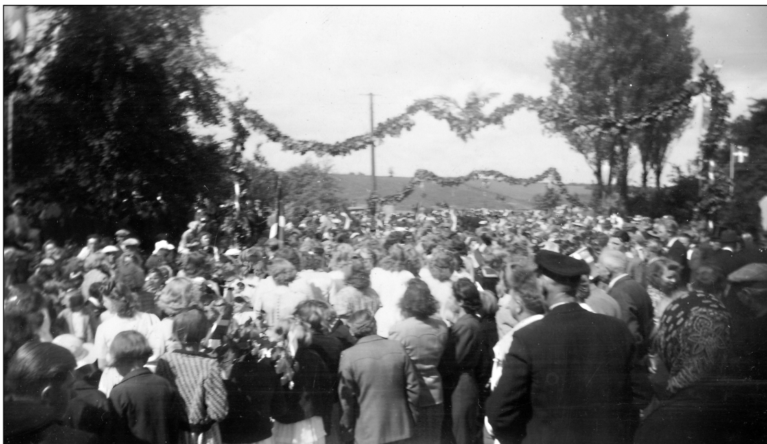
Mange var mødt op for at hilse på kongeparret.