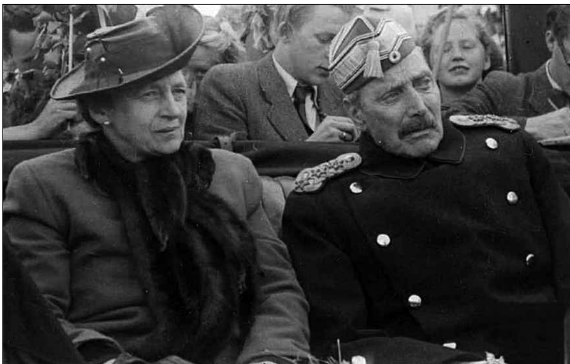
Kongen og Dronningen.