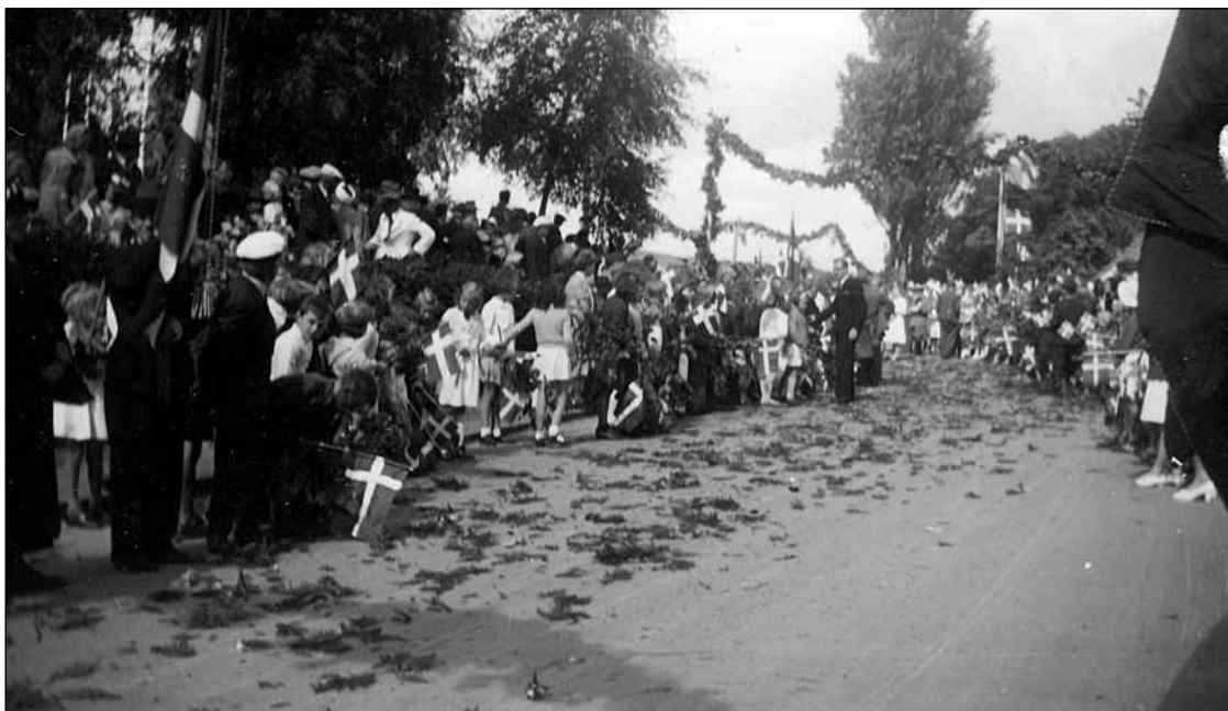
Kongen hilser på de fremmødte.