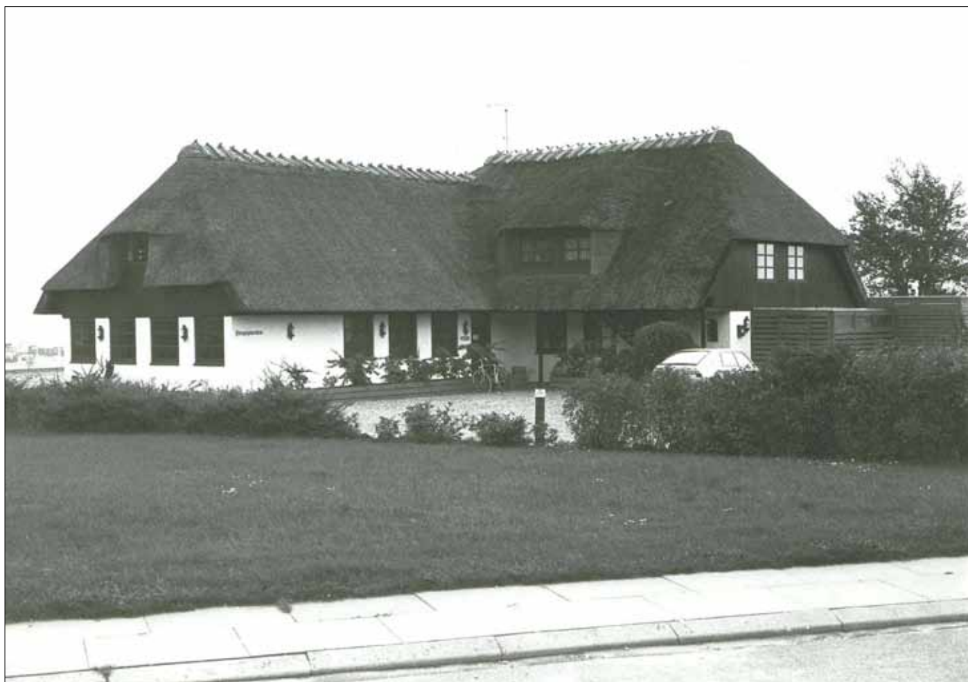
Den nye færgegård 1976

Der bliver også et par værelser at leje ud. Han er også indehaver af Hotel Fynshav, og det vil i de kommende år blive lejet ud til Mommark Handelskostskole, som her vil afvikle forskellige kurser. Hotellet får derfor nu navnet Fynshav Kursuscenter, men dog kun i 30 uger om året, idet det stadig i sommersæsonen skal bruges til turister.