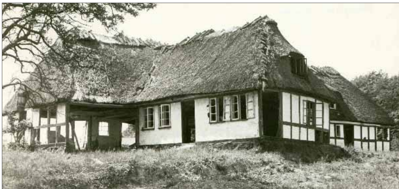
Den gamle færggård før nedbrydning