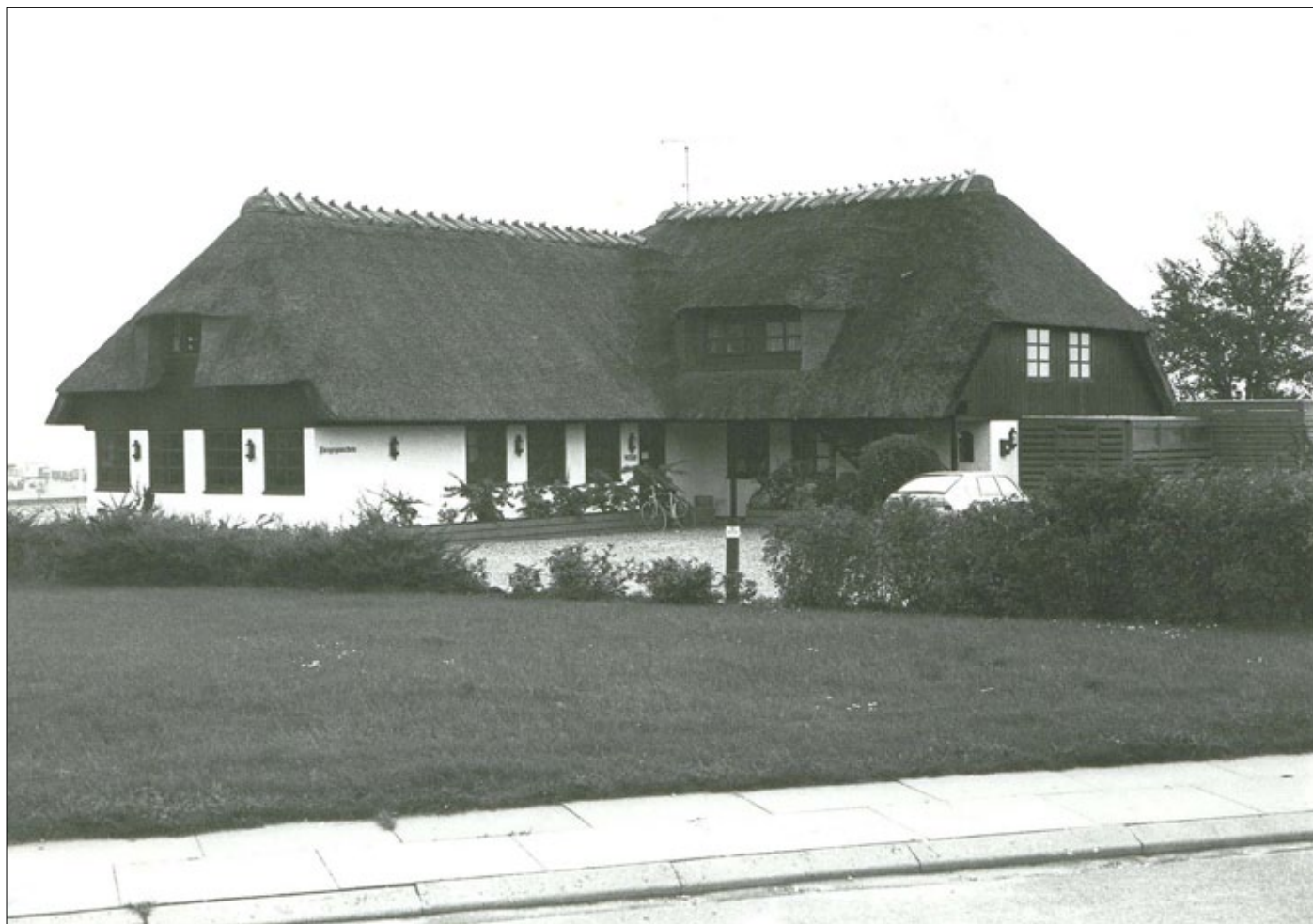
Den nye færgegård 1976

Der bliver også et par værelser at leje ud. Han er også indehaver af Hotel Fynshav, og det vil i de kommende år blive lejet ud til Mommark Handelskostskole, som her vil afvikle forskellige kurser. Hotellet får derfor nu navnet Fynshav Kursuscenter, men dog kun i 30 uger om året, idet det stadig i sommersæsonen skal bruges til turister.