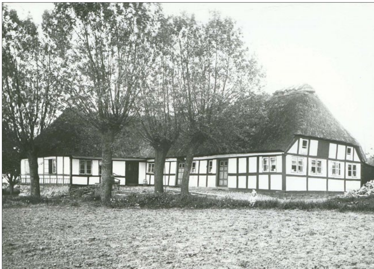
Færggården Fynshav omkring 1925/30