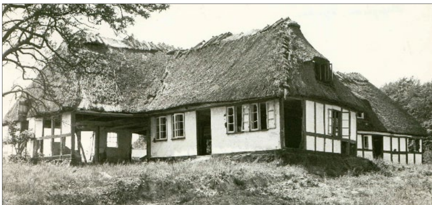
Den gamle færggård før nedbrydning