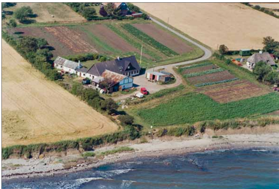
Bondeinderstestedet ca. 1989