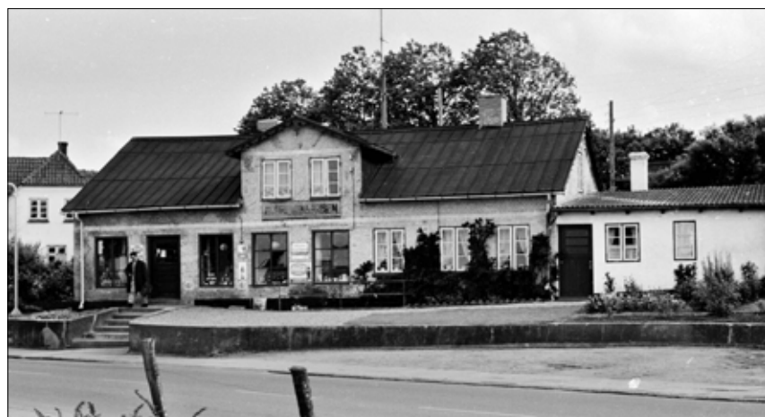
Billede fra Erik Klausens butik