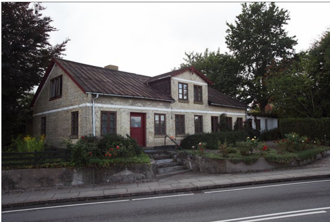
Huset er i dag privat beboelse. Billede fra 2020.