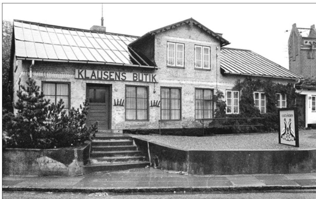
Billede fra Erik Klausens butik