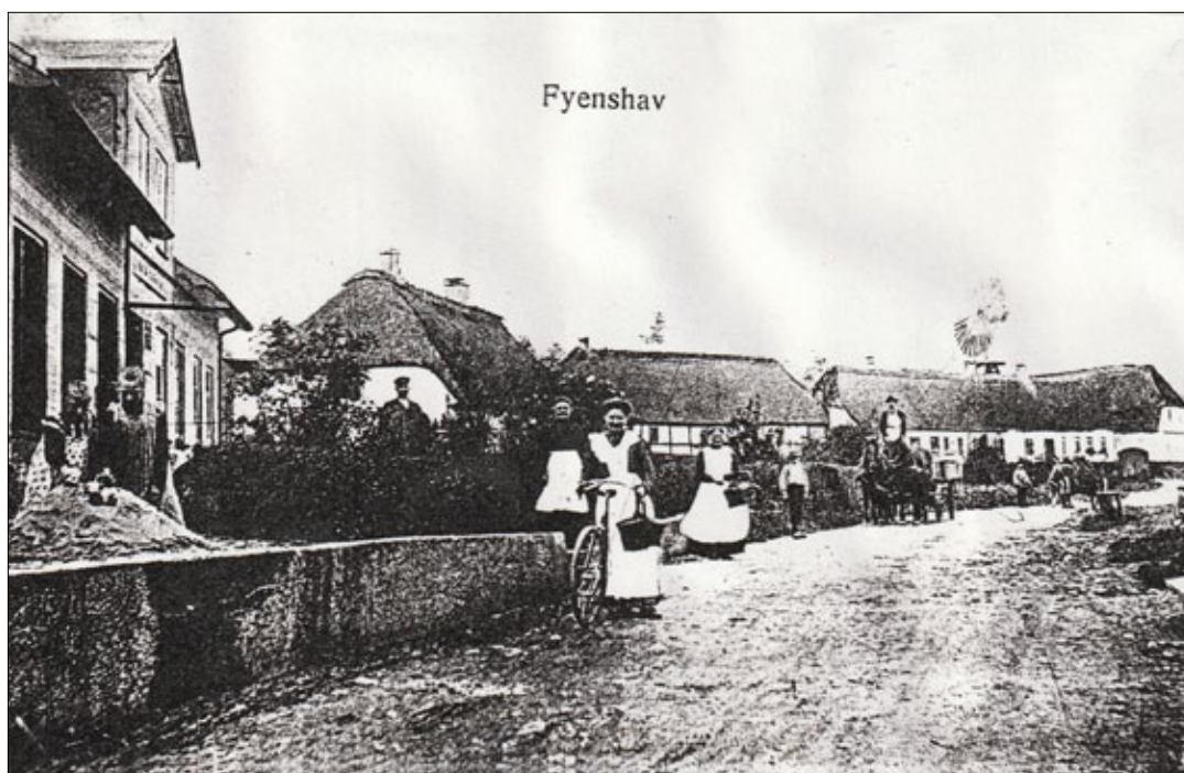
Østkystvejen 10, Østkystvejen 8 og Øvelgønne

Augustenborg herreds skyld - og panteprotokol folio 237 +