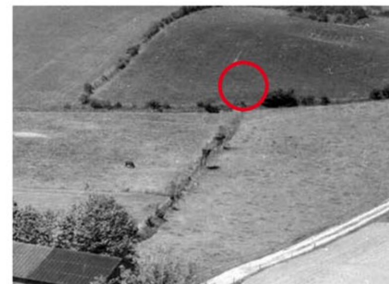
Omtrentligt findested for stenen.