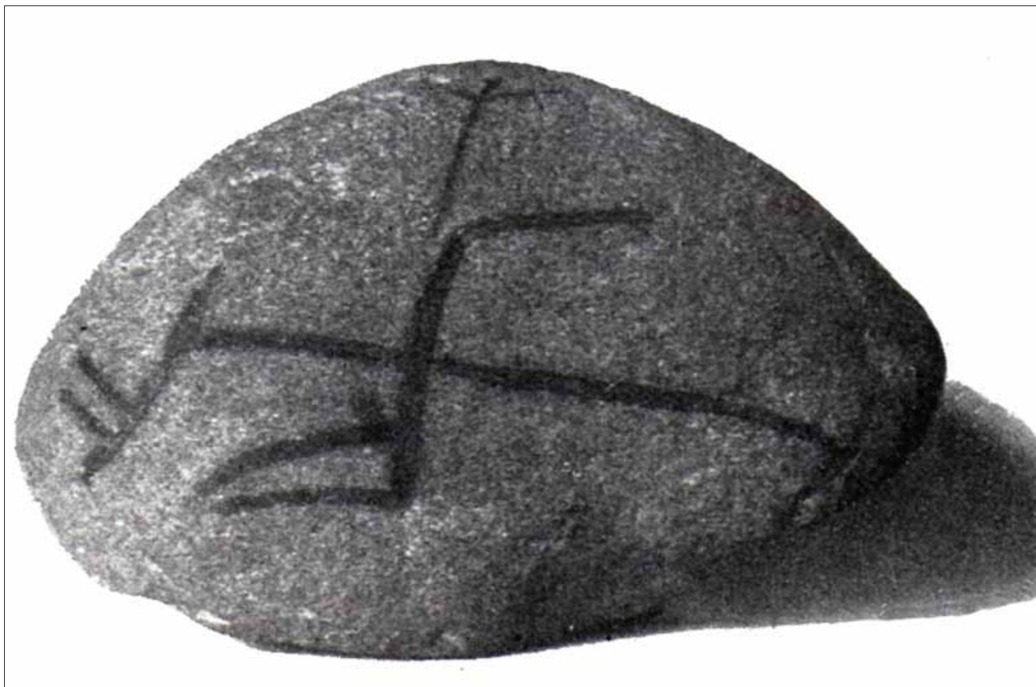
Stenen befinder sig på Sønderborg slot

Vi kan kun gisne, men ét er sikkert: Stenen viser det ældste billede af en alsisk plov.