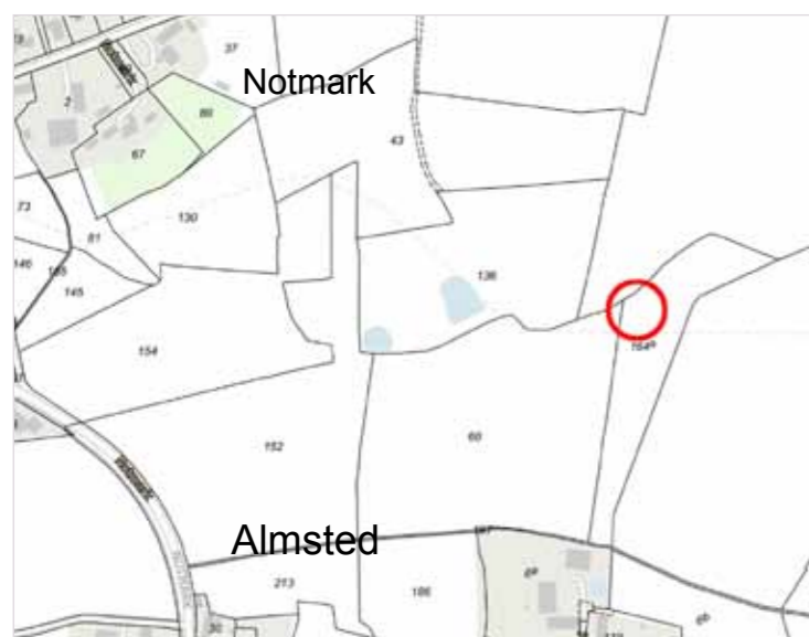
Omtrentligt findested for stenen