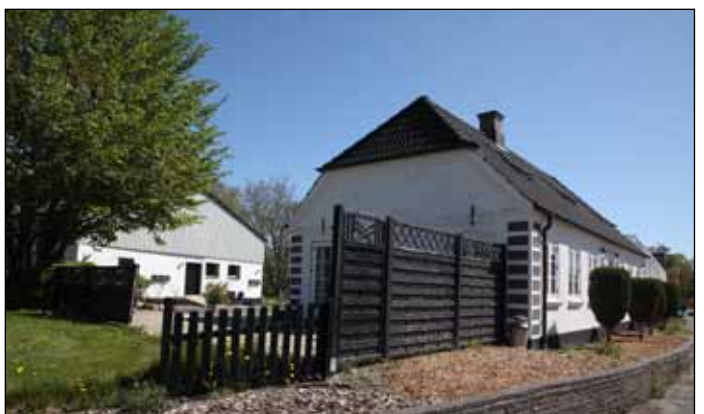
Almsted 7, 2022