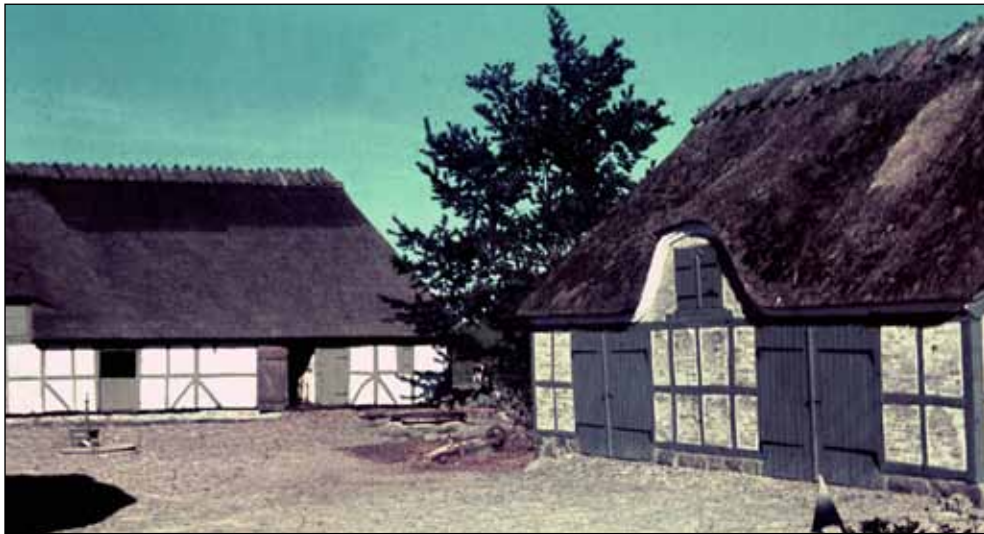
Almsted 7, matrikel 2, 1930

Almsted 7, oprindelige ejendom fra før 1667