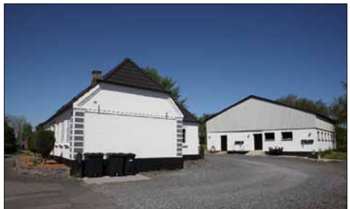
Almsted 7, 2022