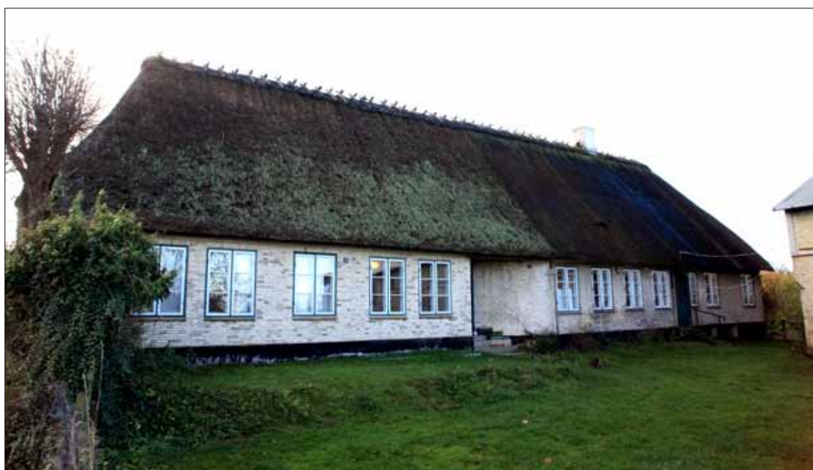
Stuehuset 2021 (Steen Weile)