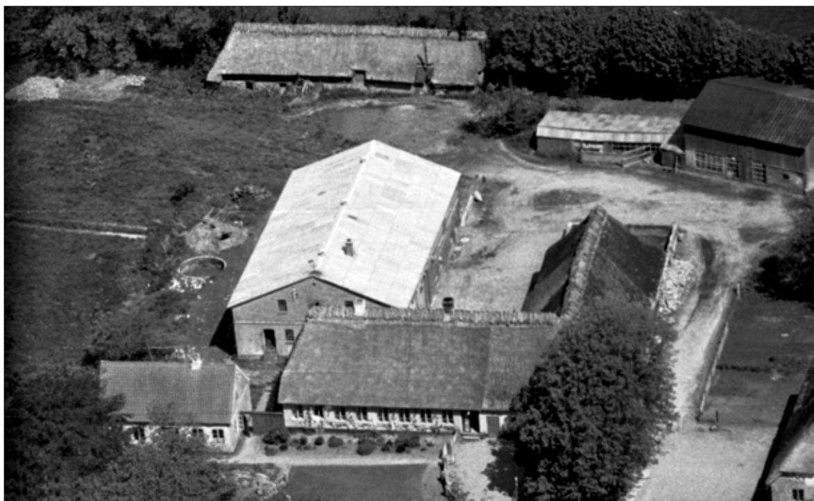
Gården ca. 1950

Alle digerne omkring æblehaven var næsten helt udjævnet, sommetider brændte soldaterne hele bunker af breve under æbletræerne. En aften ved 11-tiden kom en mængde soldater og officerer, der befalede halm båret over i vognskuret, da de skulle udkommanderes kort efter. Da soldaterne kom indenfor i laden for at hente halmen forsvandt de trætte og udasede.