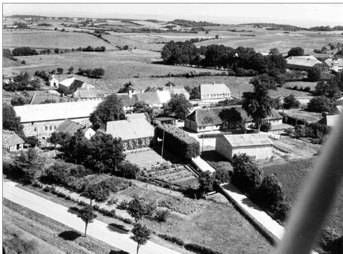
Almsted 14, matrikel 1. 1962 Det Kgl. Bibliotek.