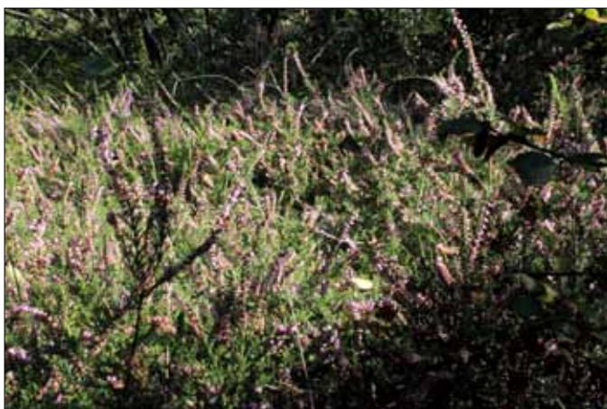
Lyng ved mosen