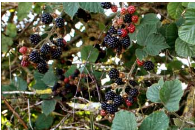
Brombær ved mosen