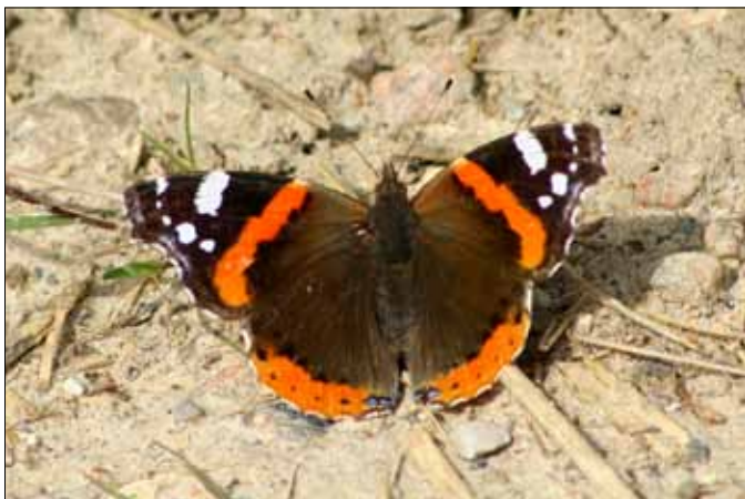
Admiral (Vanessa atalanta)