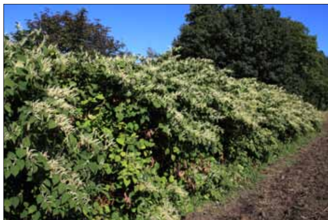
Blomstrende buske ved mosen (japansk pileurt)