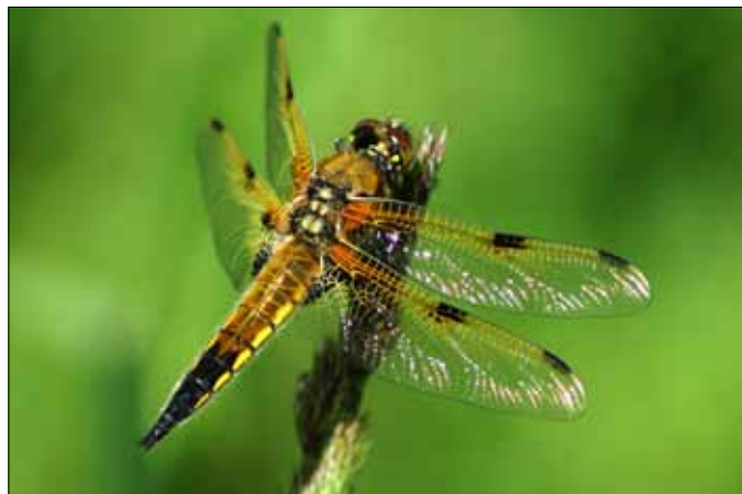
Blå libel (Libellula depressa) ung han