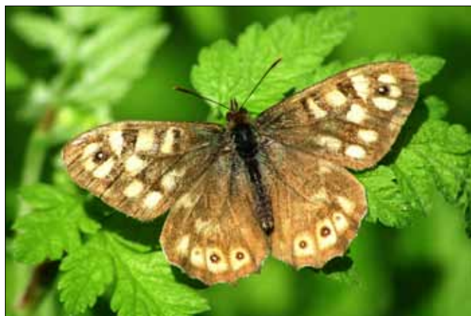
Skovrandøje (Pararge aegeria)