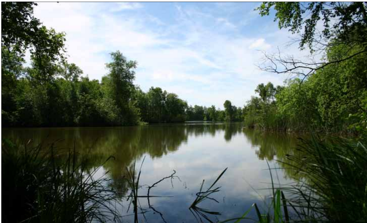
Lyngen - stille og fredfyldt