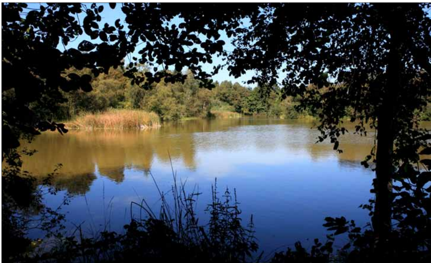
Lynge en septemberdag