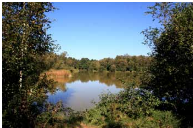
Mosen set fra en anden vinkel