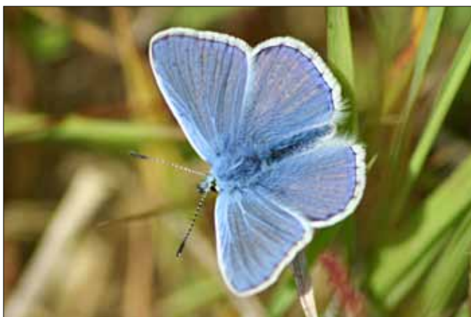
Lille blåfugl (Lycaenidae)