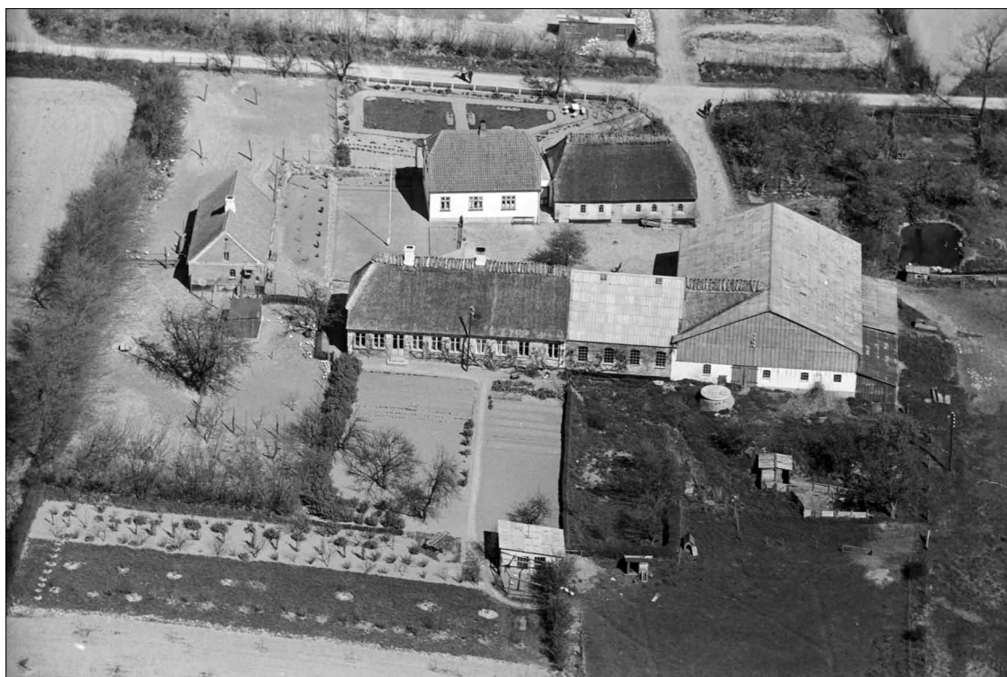
Hagelbjergmosegård 1939.