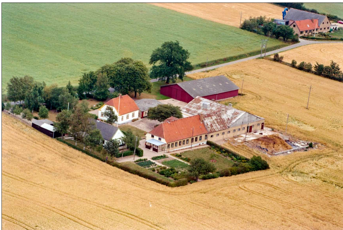
Hagelbjergmosegård 1989.