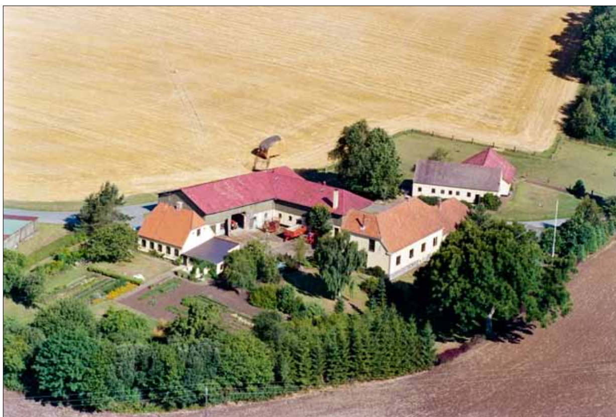
Smørholm, Almstedskov 7. 1989