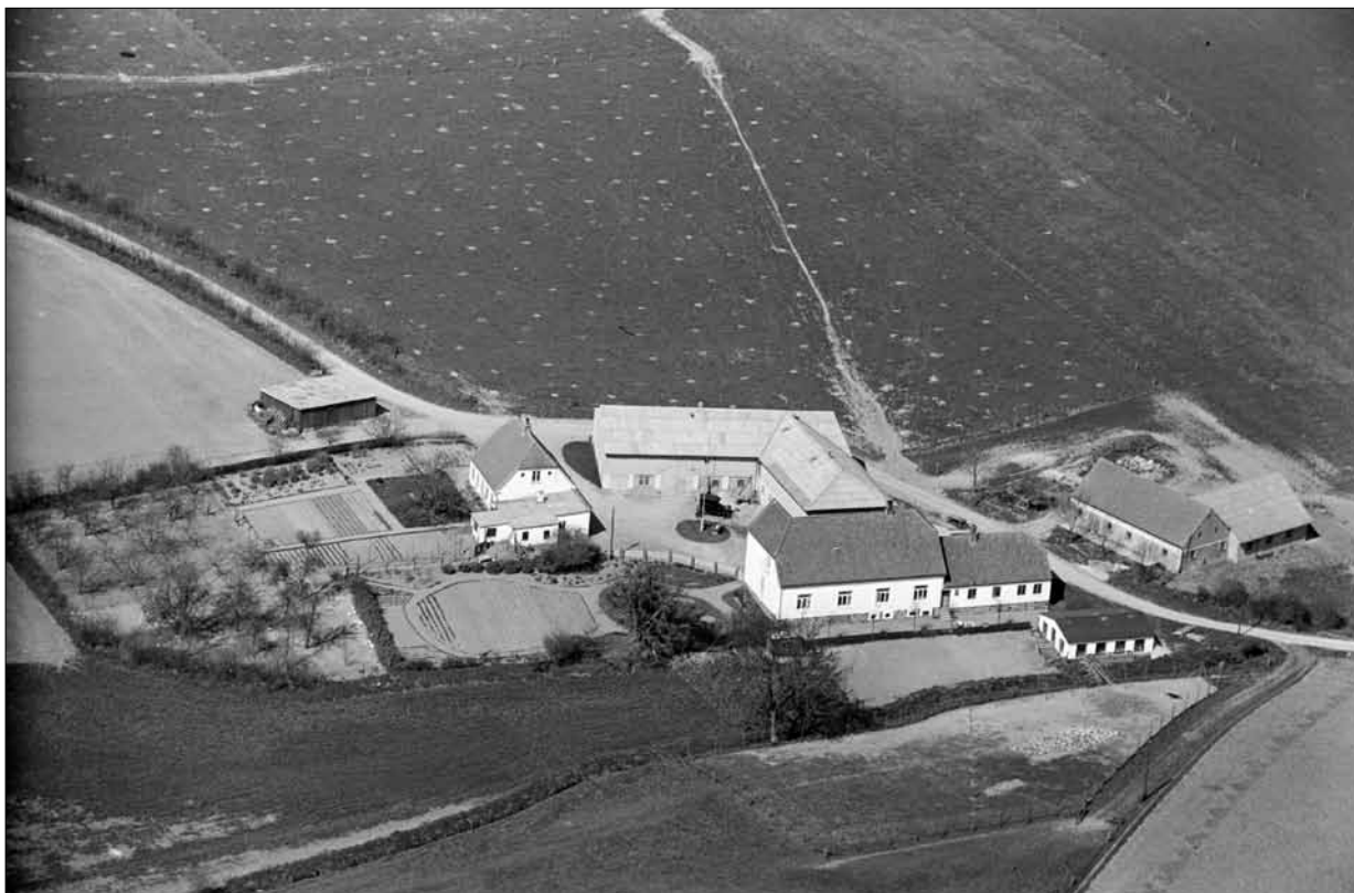
Smørholm, Almstedskov 7. 1939