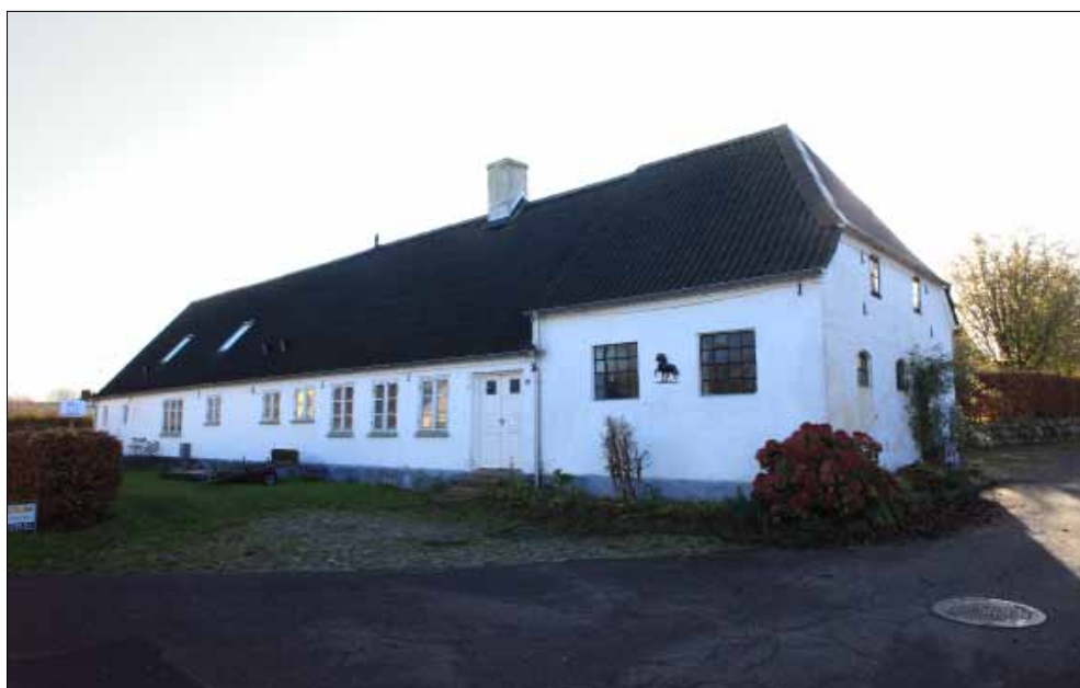
Almsted 6, matrikel 20. 2021