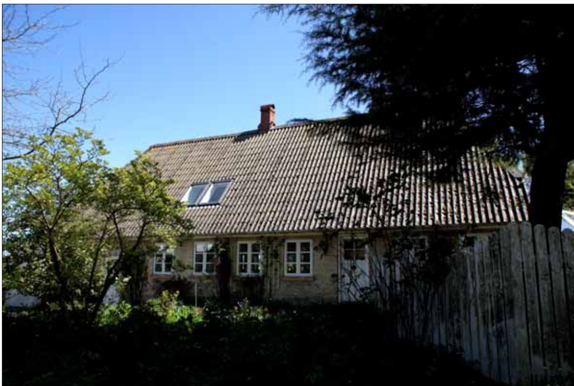
Aftægten til Kropholm 2022 (Steen Weile)

Hus nr. 27 overfor var et kådnersted med marker ved Fynshav vejen. Huset er bygget 1704 i hjørnet og blev senere aftægt til Kropholm.