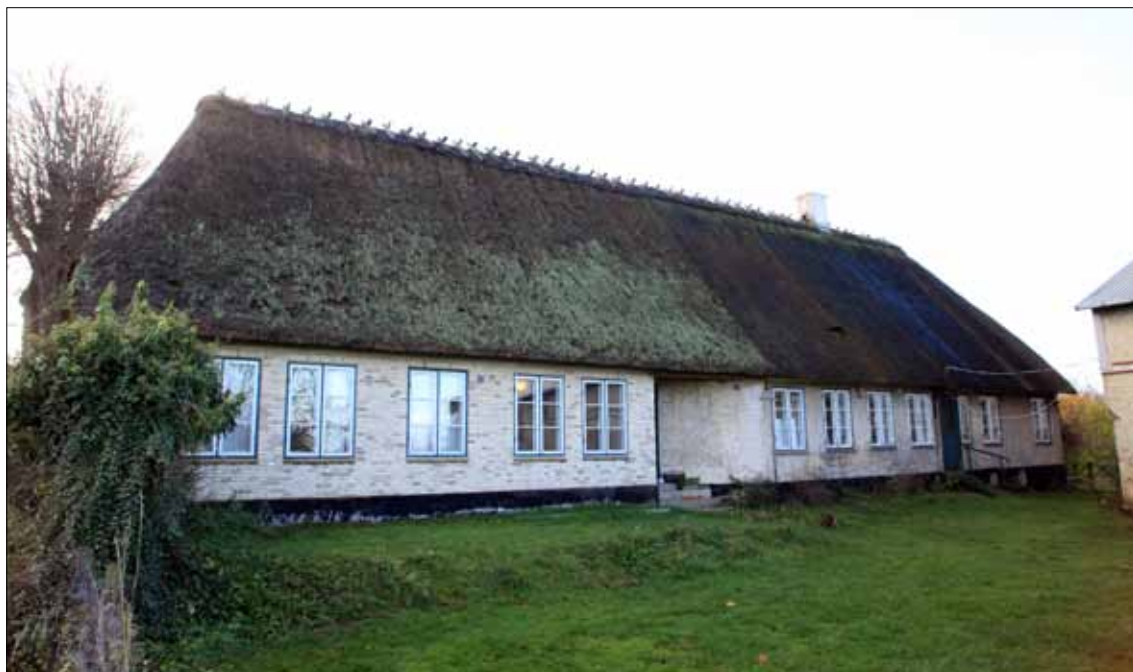
Almsted 25, matrikel 6, 2021 Stuehuset (Steen Weile).