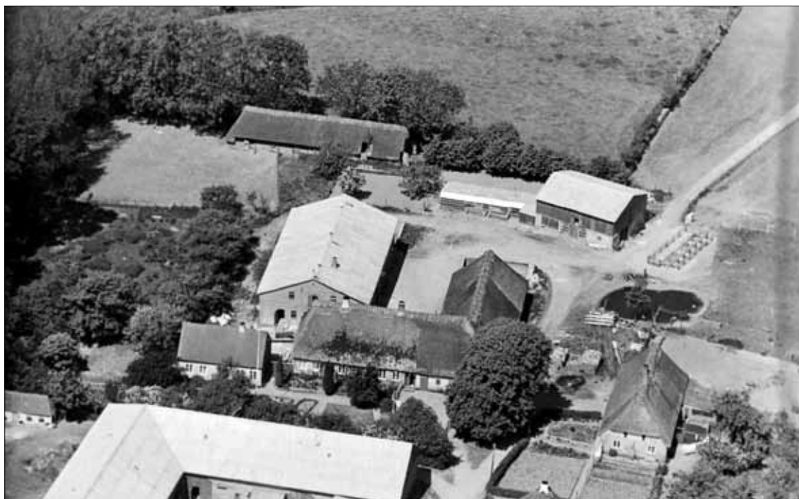
Almsted 25, matrikel 6. 1939.