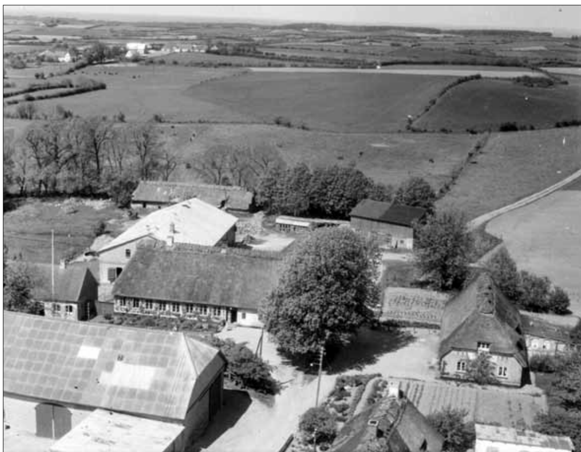
Almsted 25, matrikel 6. 1957 (Det Kgl. Bibliotek).