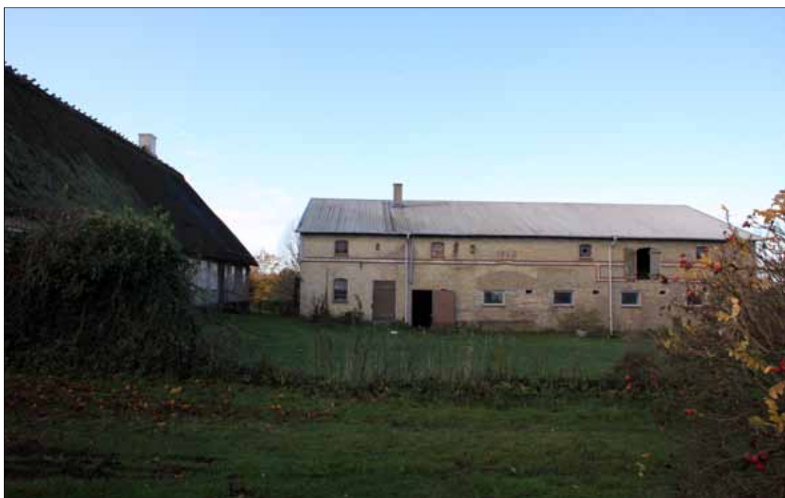
Almsted 25, matrikel 6, staldbygningen (Steen Weile).

De ældstkendte sikre oplysninger stammer fra præsten Frederik Crucows indberetning til canceliet år 1690. hvor: