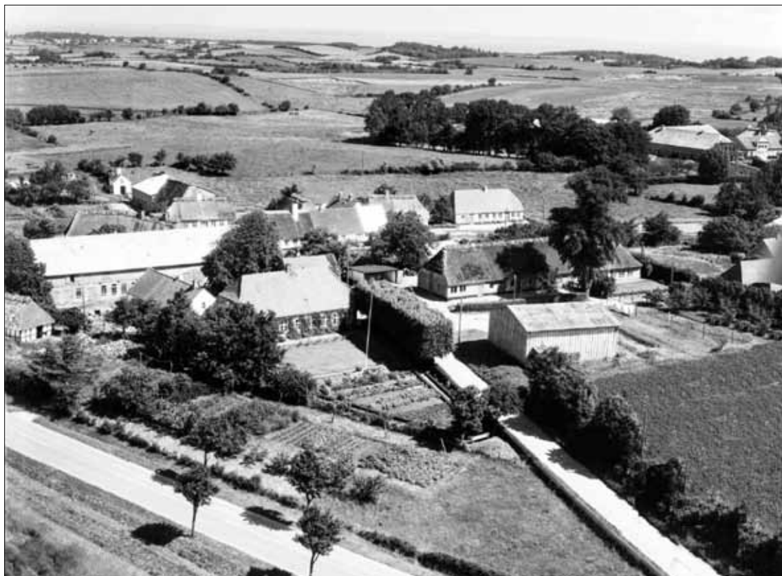
Almsted 14, matrikel 1. 1962 Det Kgl. Bibliotek.