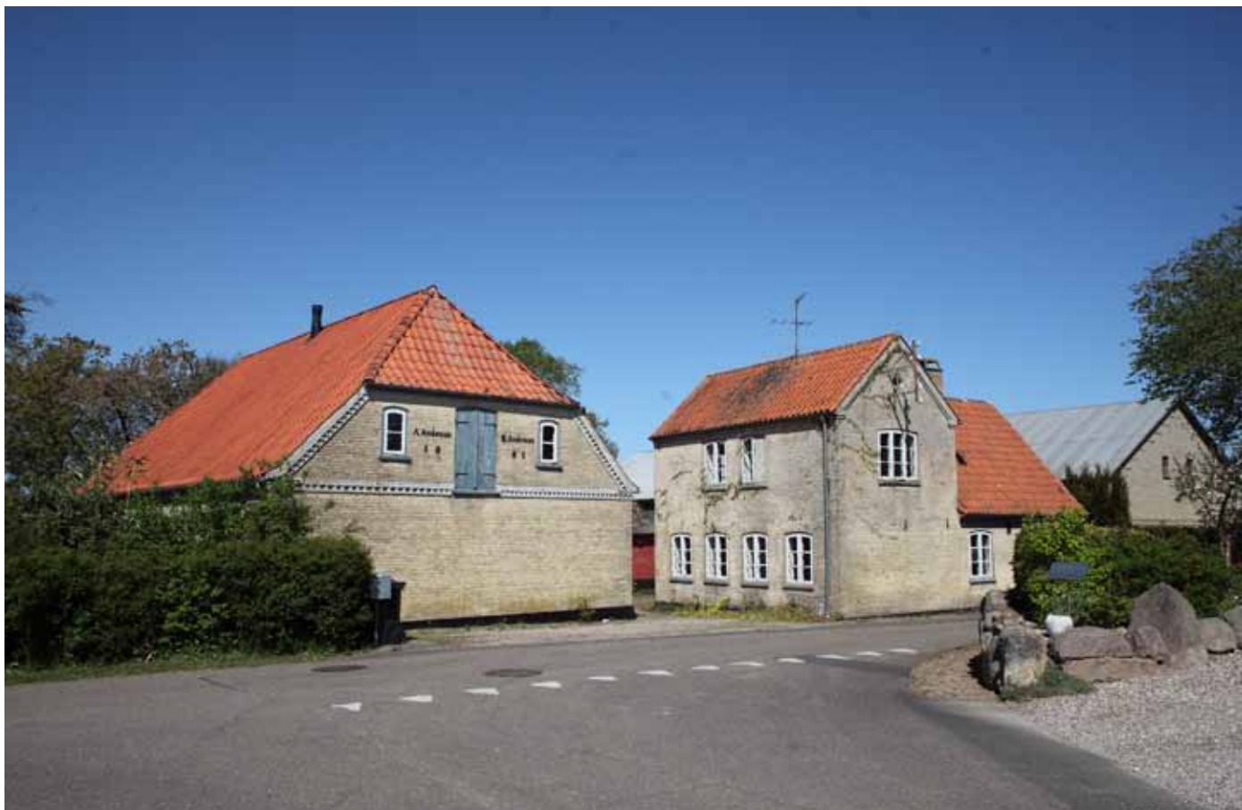
Almsted 14, matrikel 1. 2022 (Steen Weile)

Aftægtsbygningen til højre i billedet blev brækket ned sommeren 2022.