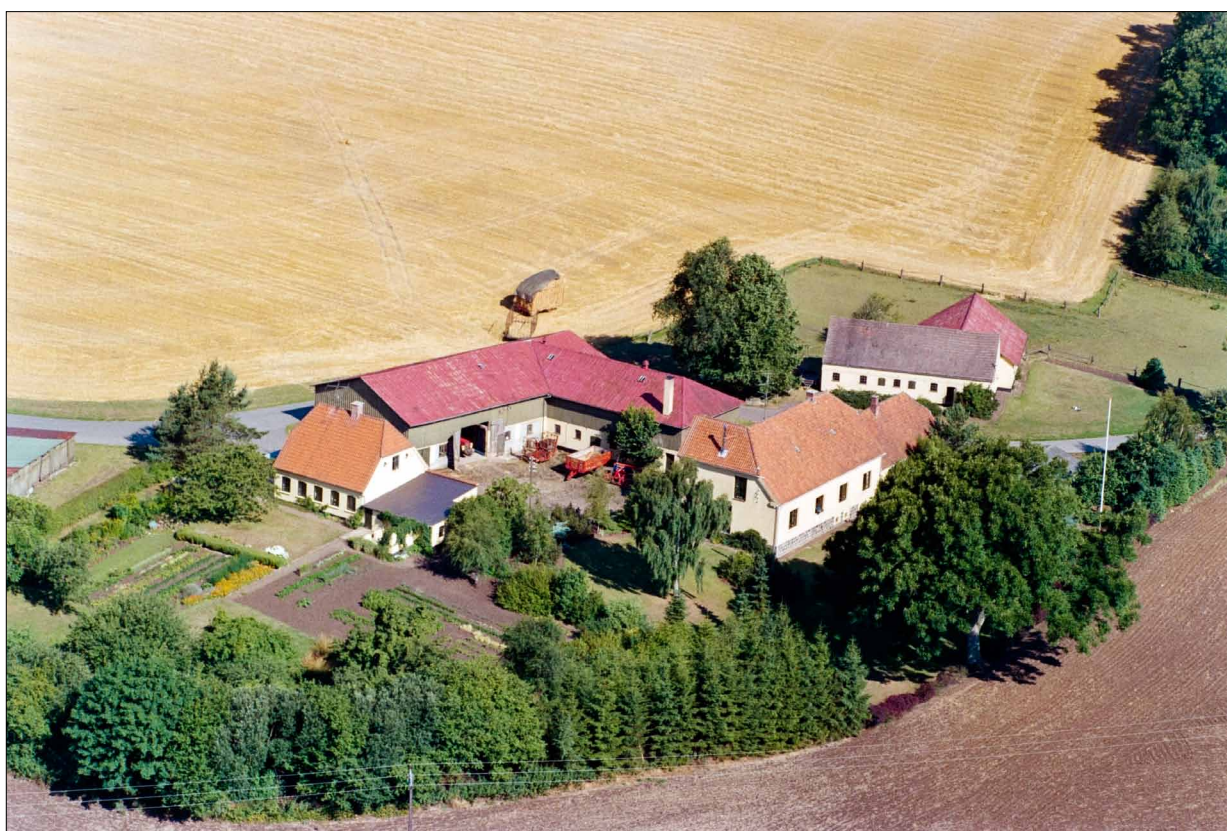
Smørholm, Almstedskov 7. 1989