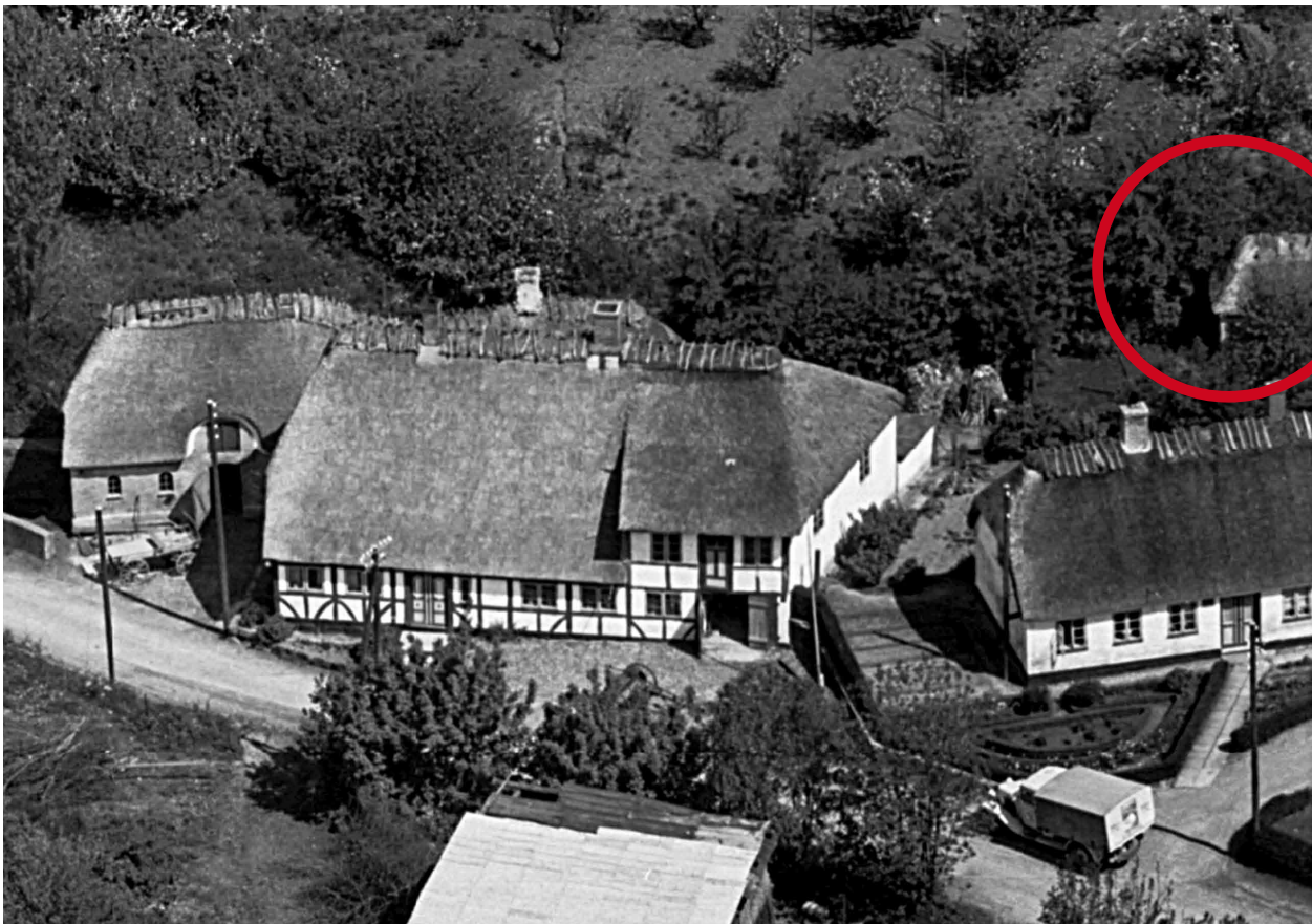
Billede med del af bygningen i haven med stråtag 1948/1952. Informationer om bygningen findes ikke.