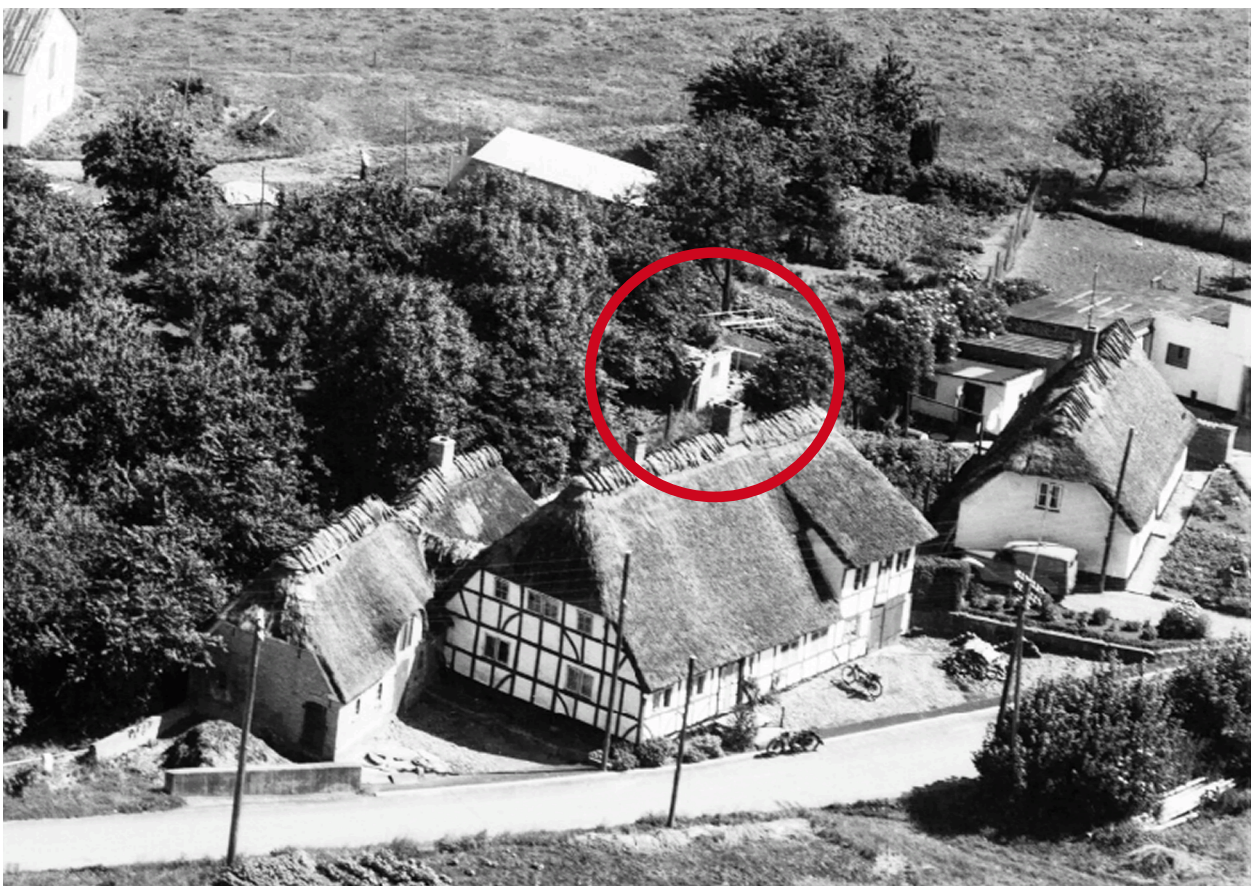
Billede med del af bygningen under nedrivning 1962.